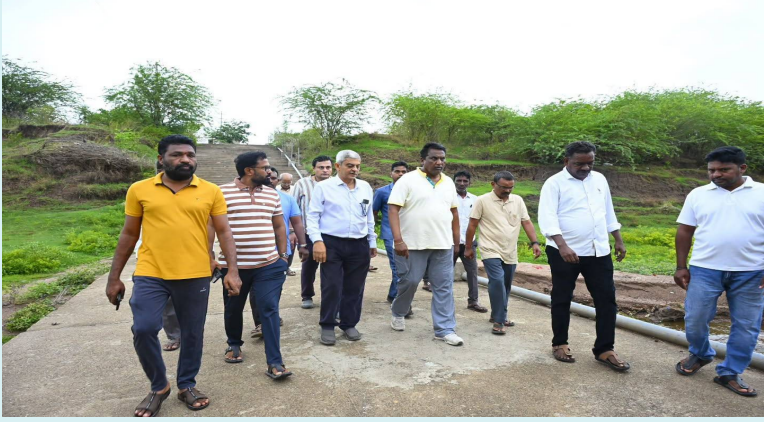
జగిత్యాల,జూన్ 30(జై భీమ్ న్యూస్):