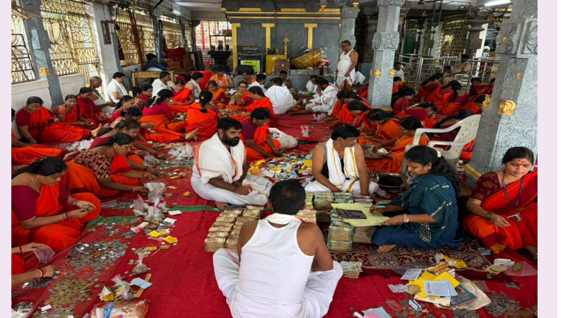
వరంగల్, 30 జూన్ 2026