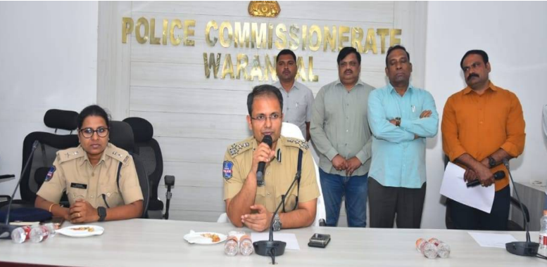
వరంగల్, 30 జూన్ 2026 (జై భీమ్ న్యూస్)