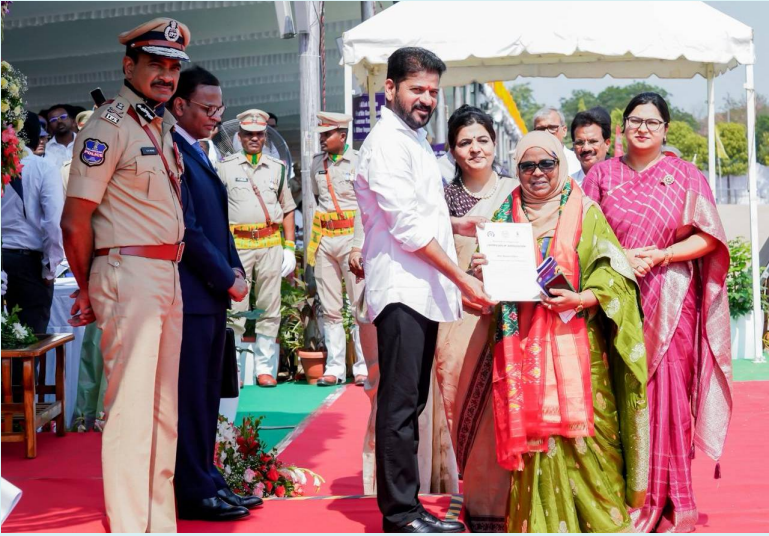
హైదరాబాద్, జూన్ 2 (జై భీమ్ న్యూస్) :

పరేడ్ గ్రౌండ్స్ లో ఘనంగా తెలంగాణ ఆవిర్భావ వేడుకలు ప్రభుత్వ పురోగతిని వివరించిన సీఎం రేవంత్ రెడ్డి అన్ని ఎన్నికల్లో ప్రజలు కాంగ్రెస్ ను ఆదరిస్తున్నారని హార్షం 4.5 లక్షల ఇళ్లు నిర్మించాలన్నదే లక్ష్యమని వెల్లడి 30 నెలల్లో ప్రజల ఆశలు, ఆకాంక్షలు నెరవేర్చామన్న సీఎం