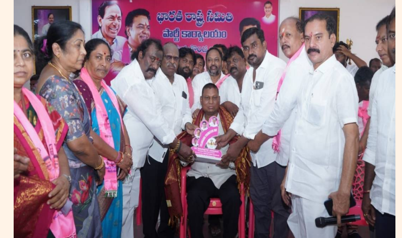
హన్మకొండ, 2 జూన్ 2026 (జై భీమ్ న్యూస్)