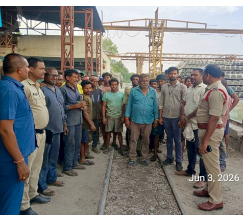
Jun 3, 2026 5:18:33 PM 161° S Yellapur Telangana