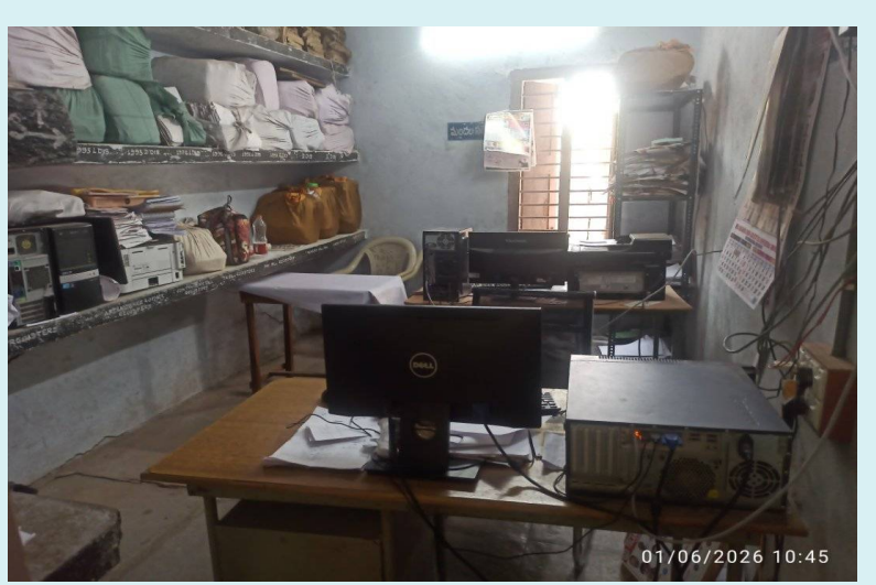
హన్మకొండ జిల్లా, జూన్ 3, 2026 (జై భీష్మ న్యూస్)

హనుమకొండ జిల్లాలోని పలు రెవెన్యూ కార్యాలయాల్లో సమయపాలన లోపాలు బహిష్కరణయ్యాయి. ప్రజలకు సేవలందించాల్సిన అధికారులు, సిబ్బంది కార్యాలయ సమయం దాటినా విధులకు హాజరుకాకపోవడంతో ప్రజలు తీవ్ర అసంతృప్తి వ్యక్తం చేస్తున్నారు. ప్రభుత్వ కార్యాలయాల సాధారణంగా ఉదయం 10 గంటలకు ప్రారంభం కావాల్సి ఉండగా, బుధవారం ఉదయం 11 గంటలు దాటినా పలు రెవెన్యూ కార్యాలయాల్లో అధికారులు, సిబ్బంది కనిపించకపోవడం చర్చనీయాంశంగా మారింది. కార్యాలయ గదుల్లో కంప్యూటర్లు, ఫైళ్లు, ఖాళీ కుర్చీలు మాత్రమే దర్శనమివ్వగా, విధులు నిర్వహించాల్సిన సిబ్బంది ఎవరూ లేకపోవడంతో ప్రజలు గంటల తరబడి నిరీక్షించాల్సి వచ్చింది. ఆదాయ, కుల, నివాస దృవీకరణ పత్రాలు, కుటుంబ సంభవ పత్రాలు, భూ సమస్యలు, ధరణి దరఖాస్తులు తదితర రెవెన్యూ సేవల కోసం ఉదయం నుంచే కార్యాలయాలకు వచ్చిన ప్రజలు తీవ్ర ఇబ్బందులు ఎదుర్కొన్నారు. ముఖ్యంగా గ్రామీణ ప్రాంతాల నుంచి వచ్చిన రైతులు, వృద్ధులు, మహిళలు అధికారుల కోసం వేచి చూడాల్సిన పరిస్థితి నెలకొంది. ప్రజలు సమయానికి కార్యాలయాలకు రావాలని సూచించే అధికారులు, ఉద్యోగులే సమయపాలన పాటించాల్సిన అవసరం ఎంతైనా ఉందిని ప్రజలు అభిప్రాయపడుతున్నారు.