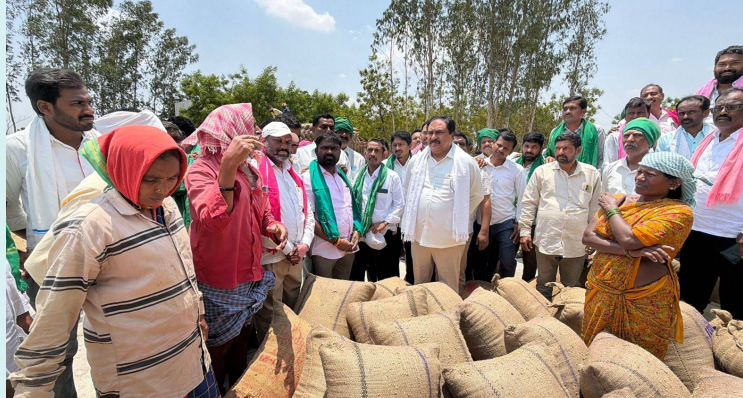
పాలకుర్తి, 3 జూన్ 2026 (జై భీమ్ న్యూస్)