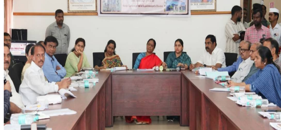
వరంగల్, 3 జూన్ 2026 (జై భీమ్ న్యూస్)