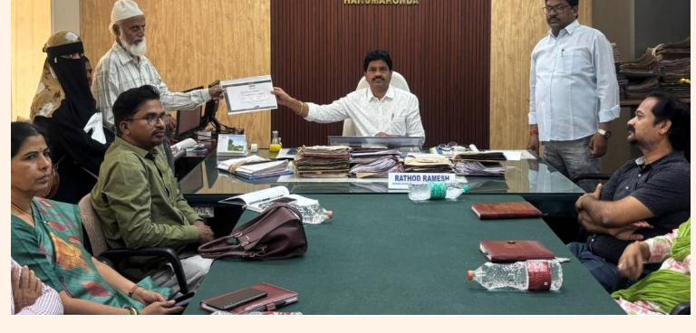
హనుకొండ, 04 మే 2026 (జై భీమ్ న్యూస్)

ఆర్టివో కార్యాలయాల్లో ప్రజావాణి కార్యక్రమం