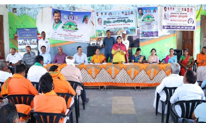
వరంగల్ జిల్లా/ గీసుగొండ, 04 మే 2026(జై భీమ్ న్యూస్)