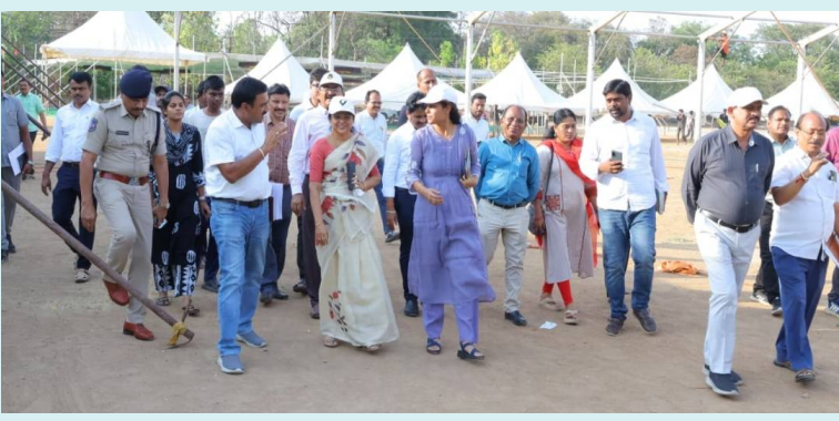
హనుకొండ, 04 మే 2026(జై భీమ్ న్యూస్)