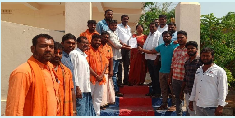
హనుకొండ జిల్లా/అంబాల, 04 మే 2026 (జై భీమ్ న్యూస్):