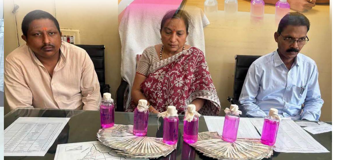
- మిగతా 2లో..