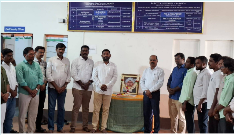
కె యు క్యాంపస్, 4 జూలై 2026