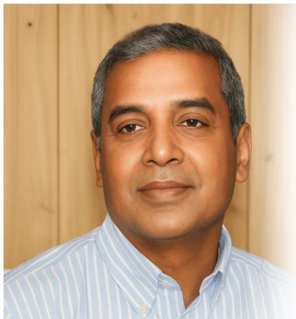
హైదరాబాద్ (జై భీమ్ డెస్క్)

తెలంగాణ రాష్ట్ర అబ్కారి వ్యవస్థతో అసవ్యంగా సాగిన ఉన్నత స్థాయి పోస్టింగ్ పట్ల రాష్ట్రవ్యాప్తంగా విమర్శలు వెళ్ళు వెళ్ళుతున్నాయని డాక్టర్ బరిగెల శివ తీవ్రమైన అసమానాలను వ్యక్తపరిచారు. జీవ్ నెంబర్ 372 ప్రకారం జరిగిన పదోన్నతుల్లో రాష్ట్ర ప్రభుత్వం తరఫున చక్రం తిప్పిన ఒక రిటైర్డ్ అధికారి అనధికార ఓఎస్టి హోదాలో తన ప్రతాపం చూపించి తనకు అనుకూలమైన అధికార వర్గానికి చూడ చక్కని పోస్టింగులను కట్టబెట్టడానికి తీవ్ర ప్రయత్నం చేసి