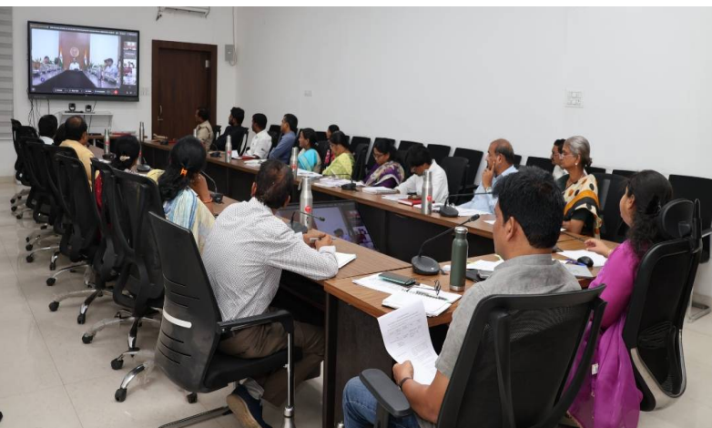
రాష్ట్ర ప్రభుత్వ ముఖ్య కార్యదర్శి రామకృష్ణారావు