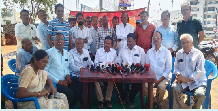
హన్మకొండ, 6 జూన్ 2026(జై భీమ్ న్యూస్)