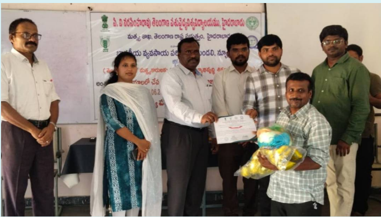
పాలేరు, 6 జూన్ 2026(జై భీమ్ న్యూస్)