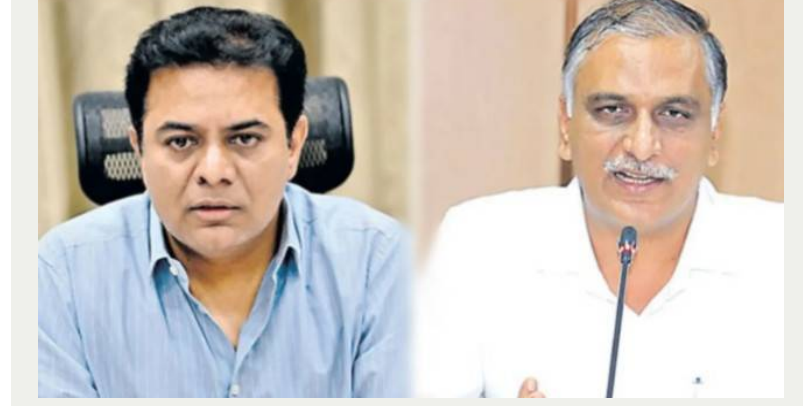
కరీంనగర్, జై భీమ్ న్యూస్

కరీంనగర్లో గంగుల కార్యాలయం వద్ద బీజేపీ కార్యకర్తల దాడి కౌశిక్ రెడ్డి ఫోన్ చేసిన కేటీఆర్ ప్రజాస్వామ్యంపై దాడి అన్న హారీశ్ రావు