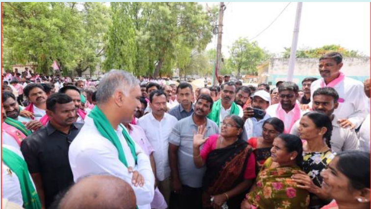
హైదరాబాద్, జై భీమ్ న్యూస్

వడ్ల కుప్పల వద్ద రైతుల గుండెలు ఆగిపోతున్నాయని ఆవేదన నెల రోజులుగా వడ్లను కొనుగోలు చేయడం లేదని విమర్శ తరుగు పేరుతో రైతులను దోచుకుంటున్నారని ఆరోపణ