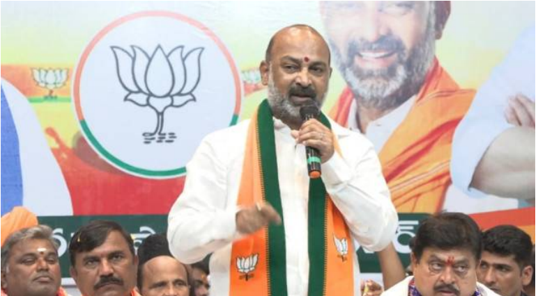
కరీంనగర్, జై భీమ్ న్యూస్

స్పందించిన బండి సంజయ్ బీఆర్ఎస్ నాయకులు మితిమీరిన అహంకారంతో ప్రవర్తిస్తున్నారని ఆగ్రహం తమ కార్యకర్తల సహనం పరీక్షించవద్దన్న బండి సంజయ్ దాడులు, దౌర్జన్యాలు తమ సంస్కృతి కాదన్న బండి సంజయ్