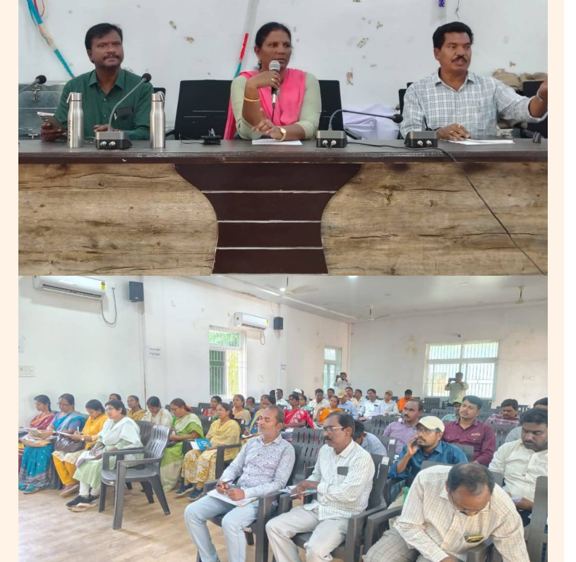
జై భీమ్ న్యూస్ /పర్యవేక్షణి ఏప్రిల్ 8

పర్యవేక్షణి మండల పరిధిలో ఇళ్ల గణనను పారదర్శకంగా, కచ్చితత్వంతో నిర్వహించాలని ఆర్డీవో సుమ అధికారులకు సూచించారు. మండల పరిషత్ కార్యాలయంలో బుధవారం నిర్వహించిన సమావేశంలో పంచాయతీ కార్యదర్శులు, ఫీల్డ్ అసిస్టెంట్లు, టెక్నికల్ అసిస్టెంట్లకు దిశానిర్దేశం చేశారు. స్పెషల్ ఇంటెన్సివ్ రివిజన్ కార్యక్రమంలో భాగంగా ఓటర్ జాబితా సవరణను వేగవంతం చేయాలని, బాత్ లెట్ అధికారులు ఇంటింటికీ వెళ్లి వివరాలు సేకరించాలని సూచించారు. ఓటర్లు తమ వివరాలను సరిచూసుకుని సరైన సమాచారం అందించాలని కోరారు. ఇళ్ల గణనలో హాస్ లిస్టింగ్ బ్లాక్స్ (నూదీ) తయారీపై ప్రత్యేకంగా మార్గనిర్దేశం చేశారు. గ్రామాలు, వార్డులను చిన్న చిన్న బ్లాక్లుగా విభజించి ప్రతి బ్లాక్ కు ఎన్యూమరేటర్లను కేటాయించాలని సూచించారు. ప్రతి బ్లాక్ లోని ఇళ్లను పూర్తిగా గుర్తించి యూనిట్ సంబంధ కేటాయించాలని, ఖాళీ ఇళ్లు, వాణిజ్య భవనాలను కూడా సమోద చేయాలని ఆదేశించారు. బ్లాక్ మ్యాపులు స్పష్టంగా రూపొందించి, ఎలాంటి ఇబ్బంది కాకుండా గణన చేపట్టాలని తెలిపారు. ప్రైవేటీ షెడ్యూల్ (గ్రా) ద్వారా ప్రతి ఇంటి వివరాలను ఖచ్చితంగా సమోద చేయాలని, ఆధార్, మొబైల్ సమాచారాన్ని ధృవీకరించాలని సూచించారు. కారోబార్స్ (జూవాడూవా) రిజిస్ట్రేషన్ బ్లాక్ల కేటాయింపు, పురోగతిని సమోద చేసి పర్యవేక్షణ చేయాలని హెచ్చరించారు. గణనలో నిర్లక్ష్యం వహిస్తే చర్యలు తప్పవని హెచ్చరిస్తూ, ప్రభుత్వ పథకాల సమర్థ అమలుకు ఖచ్చితమైన గణాంకాలు కీలకమని తెలిపారు. సమావేశంలో తహశీల్దార్ వెంకటస్వామి, ఎంపీఓఓ శంకర్, ఏసీవో సుశీల్ కుమార్ తదితరులు పాల్గొన్నారు.