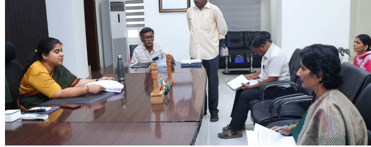
వరంగల్, 08 ఏప్రిల్ 2026 (జై భీమ్ న్యూస్)

తెలంగాణ ఓపెన్ స్కూల్ సానైటీ (టాన్) నిర్వహించే ఏఎస్సీ, ఇంటర్మీడియట్ పబ్లిక్ పరీక్షలను ఏప్రిల్ 2026లో నిర్వహించనున్నట్లు జిల్లా విద్యాశాఖ అధికారి తెలిపారు. ఈ పరీక్షలు ఏప్రిల్ 20 నుండి ఏప్రిల్ 27 వరకు జరుగునున్నాయి. జిల్లాలోని అన్ని పబ్లిక్ కేంద్రాల్లో సమగ్రంగా ఏర్పాట్లు చేపట్టినట్లు అధికారులు వెల్లడించారు. పరీక్షల నిర్వహణలో ఎలాంటి అంతరాయం కలగకుండా తగిన జాగ్రత్తలు తీసుకుంటున్నట్లు తెలిపారు. పబ్లిక్ కేంద్రాల్లో తాగునీటి సౌకర్యం, బెంచీలు, లైటింగ్, ఫ్యాన్లు వంటి మౌలిక వసతులు కల్పించడంతో పాటు విద్యార్థులకు అనుకూల వాతావరణం ఉండేలా చర్యలు చేపట్టారు. అదనంగా, పరీక్షల సమయంలో వైద్య సదుపాయాలు, ఫస్ట్ ఎయిడ్ కిట్లు, అంబులెన్స్ సౌకర్యం కూడా అందుబాటులో ఉంచినట్లు చెప్పారు. పరీక్షల నిర్వహణలో పారదర్శకతను కాపాడేందుకు ప్రత్యేక దళాలు ఏర్పాటు చేయగా, నిబంధనలు ఉల్లంఘించిన వారిపై కఠిన చర్యలు తీసుకుంటామని హెచ్చరించారు. అలాగే, పబ్లిక్ కేంద్రాల వద్ద శాంతి భద్రతలు పట్టణంగా ఉండేలా పోలీస్ శాఖతో సమన్వయం కొనసాగిస్తున్నట్లు తెలిపారు. విద్యార్థులు సమయానికి పరీక్షా కేంద్రాలకు చేరుకుని, నిబంధనలు పాటించాలని జిల్లా కలెక్టర్ సూచించారు.