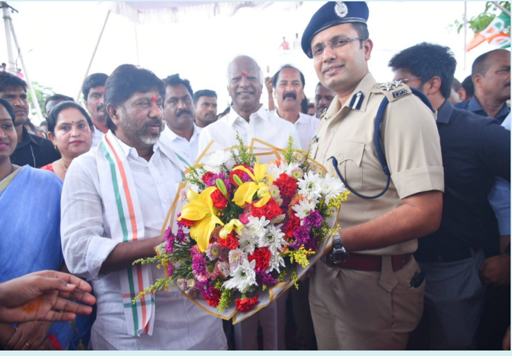
జనగామ, 9 జూన్ 2026(జై భీమ్ న్యూస్)