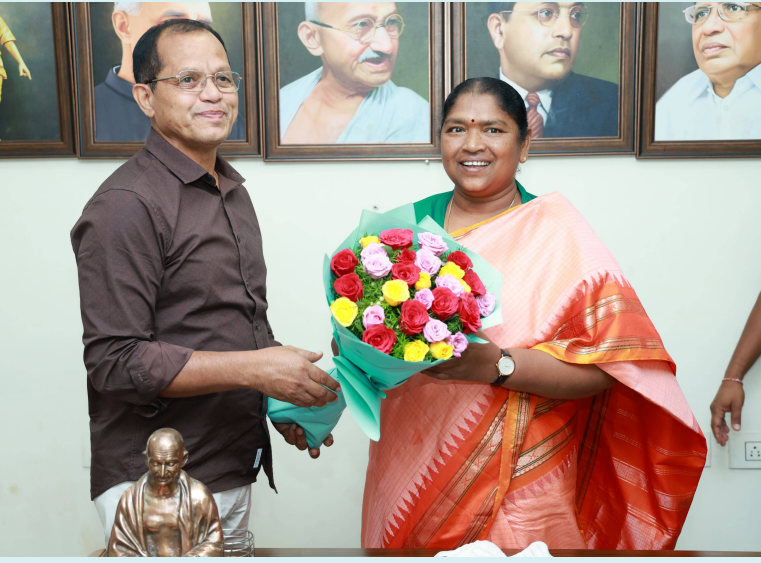
ములుగు (జై భీమ్ న్యూస్)