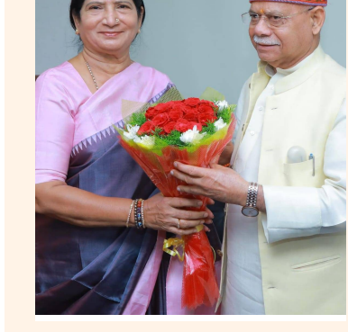
వరంగల్, 9 జూలై 2026 (జై భీమ్ న్యూస్)