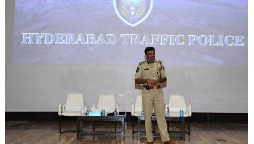
హైదరాబాద్ ట్రాఫిక్ పోలీస్

తీసుకురావడానికి ప్రణాళికలు సిద్ధం చేసి ఉన్నత స్థాయి సమీక్ష సమావేశాలు నిర్వహిస్తూ రాష్ట్రంలోని పోలీస్ ఉన్నత కార్యాలయాల్లో పోలీస్ శాఖల ఆధ్వర్యంలో రాష్ట్రవ్యాప్తంగా ఉన్నటువంటి పోలీస్ స్టేషన్స్ ఏ విధమైనటువంటి విధులను నిర్వహించాలో ఏవిధమైనటువంటి నిర్ణయాలను అమలుపరచాలో పోలీస్ బాస్ నిర్ణయించి నిర్ధారించి రాష్ట్ర పోలీస్ శాఖకు దిశా నిర్దేశం చేయడం సామాజిక తెలంగాణలో ప్రజలకు ఏ విధమైనటువంటి లాభం జరుగుతుందని ఆశిస్తో అలాంటి లాభం చేకూర్చబడే విధంగా ఉందని ప్రజలు బలంగా విశ్వసిస్తున్నారు. వేల సందర్భాల్లో పోలీసులు పేద ప్రజల వినతి పత్రాలు తీసుకోవడానికి కూడా సాహసం చేయలేని రాజకీయ ఒత్తిళ్లు కలవని అలాంటి వాటన్నింటినీ బేషరతుగా విస్మరించడంపై పేద ప్రజల కొరకు మాత్రమే ఎలాంటి ఆంక్షలు లేని విధంగా పోలీసులు పోలీసు అధికారులు పోలీస్ శాఖ రాష్ట్ర ప్రజలకు సేవ చేయాలనేది ప్రధాన లక్ష్యంగా పెట్టుకొని సాగుతున్న తీరు నా భూతో నా భవిష్యత్తుల మారేపోవడం అభినందించారు. రాష్ట్ర ప్రజలు పోలీస్ శాఖ నుండి ఏ విధమైనటువంటి సేవలను ఆశిస్తున్నారో వాటన్నింటినీ తూచా తప్పకుండా నెరవేర్చే విధంగా పోలీస్ శాఖలో నూతనమైనటువంటి ప్రణాళికలను అమలుపరుస్తున్న తీరును బట్టి పోలీస్ బాస్ ను అభినందించాలన్నారు. రాష్ట్ర ప్రజల ప్రయోజనార్థం పోలీసుల సేవలు ఎంతటి ప్రధానమో ఇలాంటి నిర్ణయాలను మామూలు కొంత మంది పోలీసులు సామాన్య ప్రజలను వేధించే పద్ధతులను మానుకున్నప్పుడే రాజకీయ నాయకులు ప్రజాప్రతినిధులు సిగ్గుతో తలదించుకోవాల్సి వస్తుందని తెలిపారు. ఒక రాష్ట్ర పోలీస్ అధికారిగా ప్రజలకు ఏ విధంగా మేలు చేయాలో ఉన్నతమైన కోణంలో ఆలోచన చేసి ప్రజల పైపు నిలబడుతున్న రాష్ట్ర పోలీస్ బాస్ ప్రత్యేకతను చూసి రాజకీయ నాయకుల్లో కూడా మార్పు రావాలని కోరారు.