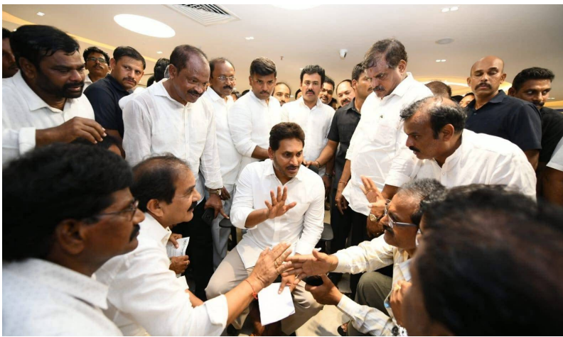
కార్మికులను తగ్గించడంతో పెరిగిన పనిభారం బాధిత కుటుంబాలకు జగన్ పరామర్శ ప్రభుత్వం నిర్లక్ష్యంపై మండిపాటు