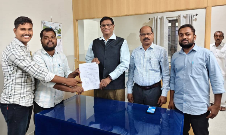
కేయూ క్యాంపస్ జై భీష్మ న్యూస్:-

ఇస్టాని అవినీతి అసాంఘిక కార్యక్రమాలను వెలుగులోనికి తేవాలి ఇస్టాని ఉద్యోగ అక్రమాలపై చర్యలు తీసుకోవాలి గతంలో ఇస్టానిపై ఇచ్చిన వినతి పత్రాల ఆధారంగా విచారణ చేపట్టాలి విశ్వవిద్యాలయ చట్టాలకు ఇస్టాని ఒక్కణికే మినహాయింపేంది ఇస్టాని పై చర్యలు వేగవంతం చేయకపోతే పెద్ద ఎత్తున ఉద్యమాలు చేస్తాం యూనివర్సిటీ మాజీ హాస్టల్ డైరెక్టర్ ఇస్టానిపై వేసిన కమిటీ రిపోర్టును విడుదల చేయాలి ఇస్టానిపై గతంలో వచ్చిన విడుదల ఆరోపణలపై పలుమార్లు వీసీకి విన్నోరు అవినీతి పరులకు వత్తాను పలుకుతున్న కెయూ అధికారులు అవినీతి అపైర్స్ ఉన్న వ్యక్తికి స్టూడెంట్స్ అపైర్స్ డీన్ ఇవ్వడం చాలా సిగ్గుచేటు వెంటనే ఇస్టానిపై వేసిన కమిటీ రిపోర్టును బహిరంగం చేసిన, స్టూడెంట్స్ అపైర్స్ డీన్ పదవి నుండి తొలగించాలి డిఎన్ఎ, పిడిఎస్కు విద్యార్థి సంఘాల ఆధ్వర్యంలో వీసీకి వినతిపత్రం అందచేత