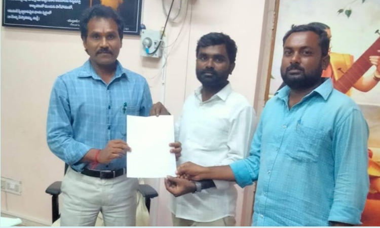
హాస్టల్ కౌండ, 10 జూన్ 2026 (జై భీష్మ న్యూస్)

కన్వీనర్ కు డిఎన్ఎ, డిఎస్ఎ నాయకుల వినతిపత్రం