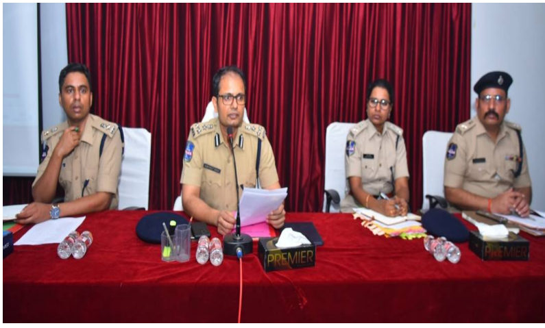
వరంగల్, 11 జూన్ 2026(జై భీమ్ న్యూస్)