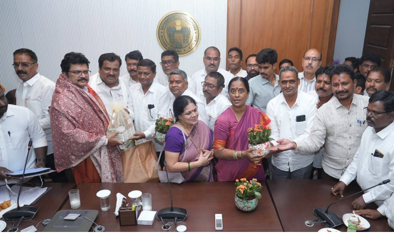
26 మంది ఈవోలకు పదోన్నతి ఉత్తర్వులు అందజేసిన మంత్రి కొండా సురేఖ

హైదరాబాద్, 12 జూన్ 2026 (జై భీమ్ న్యూస్) దేవదాయ శాఖలో పనిచేస్తున్న ఉద్యోగులు, అర్జుకులు, ఇతర సిబ్బందికి దక్కాల్సిన హక్కులు, సంక్షేమ ప్రయోజనాలు పూర్తిస్థాయిలో అందేలా రాష్ట్ర ప్రభుత్వం కట్టుబడి ఉందని రాష్ట్ర అటవీ, వర్షావరణ, దేవదాయ ధర్మాదాయ శాఖ మంత్రి కొండా సురేఖ అన్నారు. డాక్టర్ బి.ఆర్. అంబేద్కర్ తెలంగాణ రాష్ట్ర సేవాలయంలో శుక్రవారం నిర్వహించిన కార్యక్రమంలో గ్రేడ్-2 నుంచి గ్రేడ్-1 కార్యనిర్వహణ అధికారులుగా (ఈవోలు) పదోన్నతి పొందిన 26 మంది అధికారులకు మంత్రి కొండా సురేఖ ప్రమోషన్ ఉత్తర్వులను అందజేశారు. ఈ సందర్భంగా అర్జుకులు, దేవదాయ శాఖ ఉద్యోగులకు అమలవుతున్న పలు సంక్షేమ పథకాల ప్రయోజనాలను కూడా పెంచుతున్నట్లు ప్రకటించారు. మంత్రి మాట్లాడుతూ ఉద్యోగులు, అర్జుకులు సంప్రత్తిగా ఉంటే భక్తులకు మెరుగైన సేవలు అందించగలరని ప్రభుత్వం విశ్వసిస్తోందన్నారు. నిబంధనల ప్రకారం వారికి