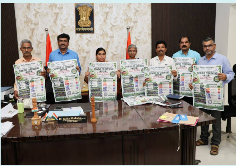
వరంగల్, 12 జూన్ 2026 (జై భీమ్ న్యూస్)