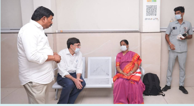
హైదరాబాద్, 12 జూన్ 2026 (జై భీమ్ న్యూస్)

నిందితుడికి కఠిన శిక్ష పడేలా చర్యలు తీసుకుంటాం: మంత్రి కొండా సురేఖ