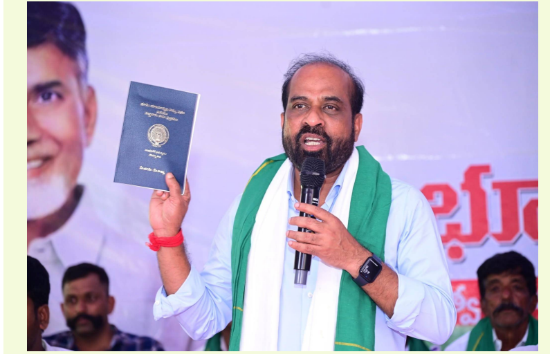
విజయవాడ, జూన్ 13 (జై భీమ్ న్యూస్):

పీదల చెంతకు వైద్యారోగ్య సేవలు ప్రభుత్వంపట్ల పేరిగిన రోగుల సంఖ్య వైద్యారోగ్యశాఖ మంత్రి నక్షత్రకూమర్ వెల్లడి