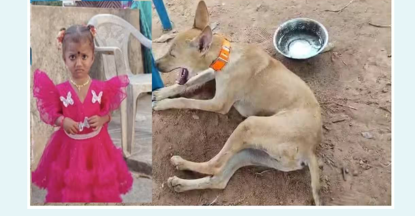
కాకినాడ, జూన్ 13 (జై భీమ్ న్యూస్):