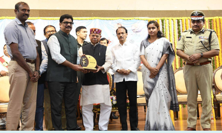
హనుమకొండ, 14 జూన్ 2026(జై భీమ్ న్యూస్)