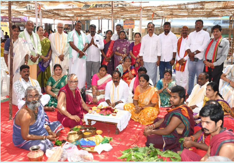
వరంగల్, 15 జూన్ 2026 (జై భీమ్ న్యూస్)