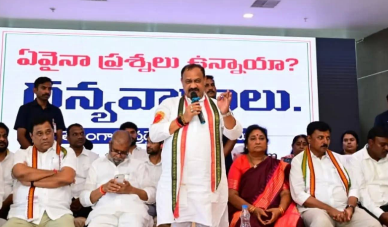
కేంద్రానికి తొత్తుగా మారిన ఎన్నికల సంఘం బెంగాల్ లో 92 లక్షల ఓట్ల తొలిగింపే నిదర్శనం బూత్ లెవల్ ఏజెంట్ల సమావేశంలో పిసిసి చీఫ్ విమర్శలు