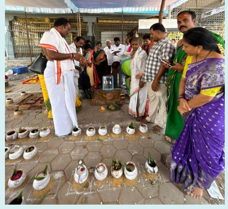
వరంగల్, 16 జూన్ 2026 (జై భీమ్ న్యూస్)