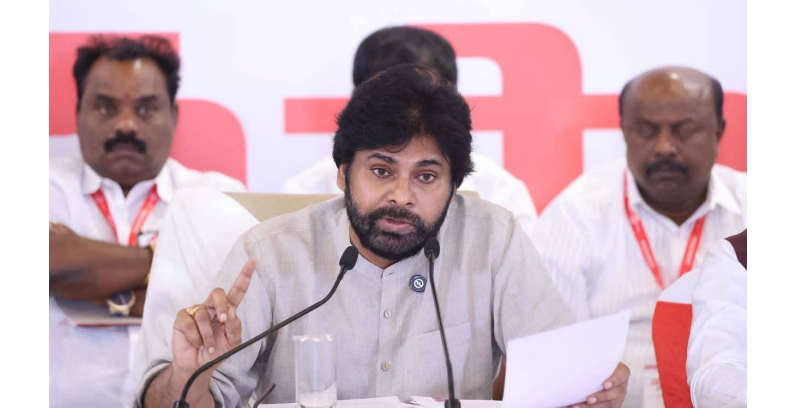
అమరావతి, జూన్ 16 (జై భీష్మ న్యూస్):