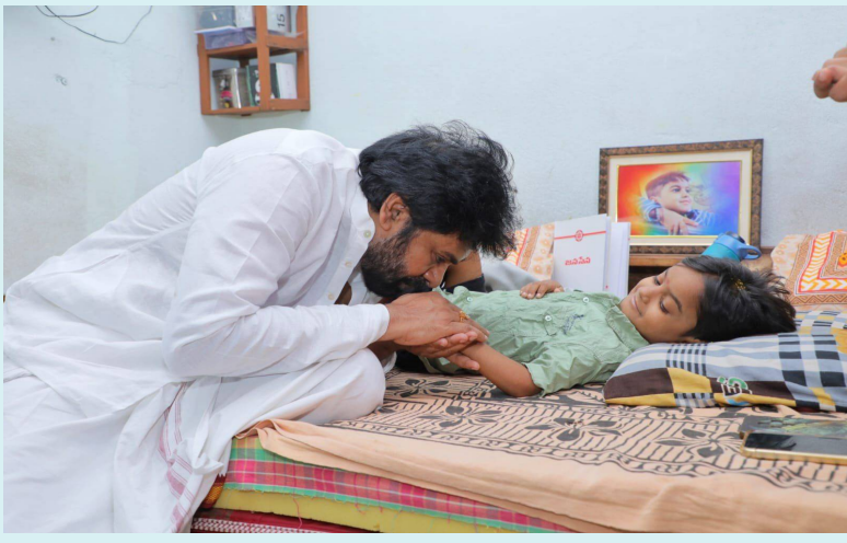
హన్మంట్, 17 జూన్ 2026 (జై భీమ్ న్యూస్)

ఆరోగ్య పరిస్థితిపై ఆరా.. కుటుంబానికి భరోసా వైద్య ఖర్చులకు రూ. లక్ష సాయం.. నిర్మాత బండ్ల గణేష్ నుంచి రూ.5 లక్షల ఆర్థిక సహాయం