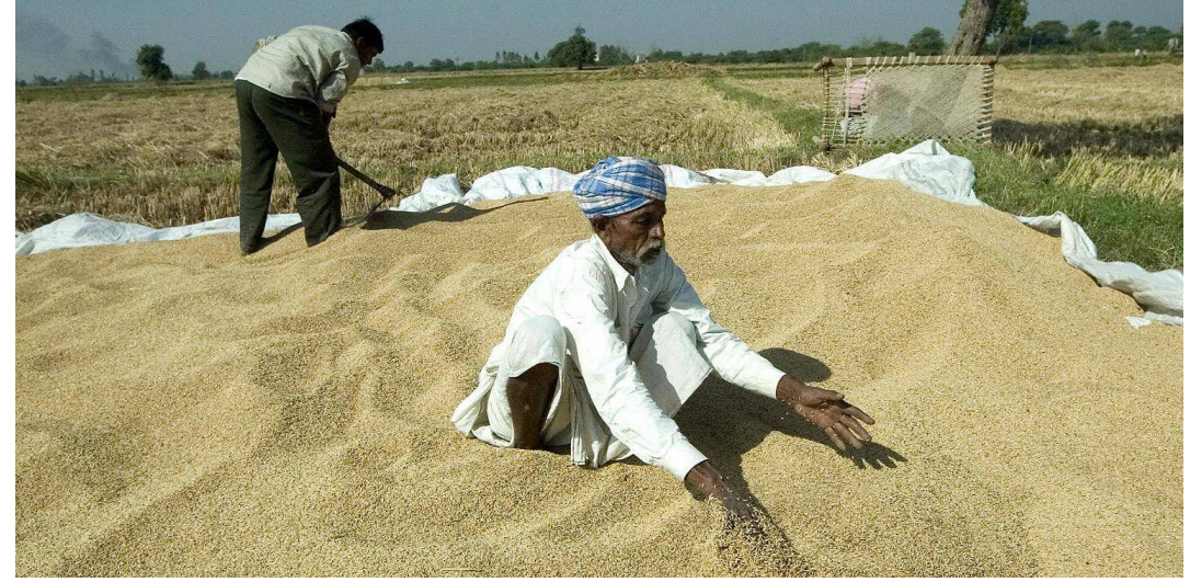
వెలికితీయడానికి ప్రభుత్వాలకే కాదు కదా ధాన్యం కొనుగోలు కేంద్రాల యజమాన్యాల కూడా మనసాధ్యం లేదని నిలదీశారు.