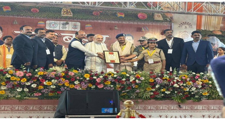
దేశంలోనే ప్రత్యేకతను చాటుకున్న తెలంగాణ పోలీస్ శాఖ.

తెలంగాణను నక్కల్ రహిత రాష్ట్రంగా తీర్చిదిద్దిన పోలీసు అధికారులను సన్మానించిన కేంద్ర హోం మంత్రి అమిత్ షా