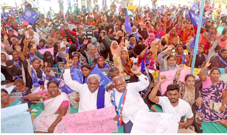
బెంగళూరు, జై భీమ్ న్యూస్ :

"మాకు తలదాచుకోవడానికి చోటు కల్పిస్తే, దీనికి బాధ్యులైన వారందరినీ ధన్యవాదాలు తెలిపి ప్రశాంతంగా బతుకుతాం. లేకపోతే, కనీసం మమ్మల్ని జైల్లో పెట్టండి. అప్పుడు మాకు నివసించడానికి ఒక చోటు, రోజుకు మూడు పూటల భోజనం అయినా లభిస్తుంది." అని ప్రభుత్వం తమ ఇళ్లను కూల్చివేయడంతో నిరాశ్రయులైన కోగిలు లేఅవుట్ మురీకివాడ నివాసితుల ఆవేదన ఇది. డిసెంబర్ 20, 2025న, బెంగళూరు ఉత్తర తాలూకాలోని యలహంక ప్రాంతంలో ఉన్న కోగిలు లేఅవుట్లోని రెండు వందలకు పైగా పేద కుటుంబాల ఇళ్లు అక్రమమైనవని పేర్కొంటూ గ్రేటర్ బెంగళూరు అథారిటీ (జీబీఏ) వాటిని కూల్చివేసింది. ప్రజలు నిద్రలేవక ముందే, తెల్లవారుజామున అధికారులు చేపట్టిన ఈ ఆపరేషన్, షెడ్యూల్డ్ కులాలు, మైనారిటీలు, వెనుకబడిన తరగతులు, అసంఘటిత కార్మికులు, గృహ కార్మికులతో సహా వివిధ వర్గాలకు చెందిన పేద ప్రజలను వీధిపాలు చేసింది. ఇళ్లు కూల్చివేసిన 8 రోజుల తర్వాత పునరావాసం కల్పిస్తామని ప్రభుత్వం హామీ ఇచ్చింది. రాజీవ్ గాంధీ హౌసింగ్ కార్పొరేషన్ అత్యవసరంగా నర్సీను పూర్తి చేసింది. పత్రాల పరిశీలన ప్రక్రియ కూడా పలు దశల్లో జరిగింది. మంత్రులు, ఎమ్మెల్యేలు, ముఖ్యమంత్రి కూడా