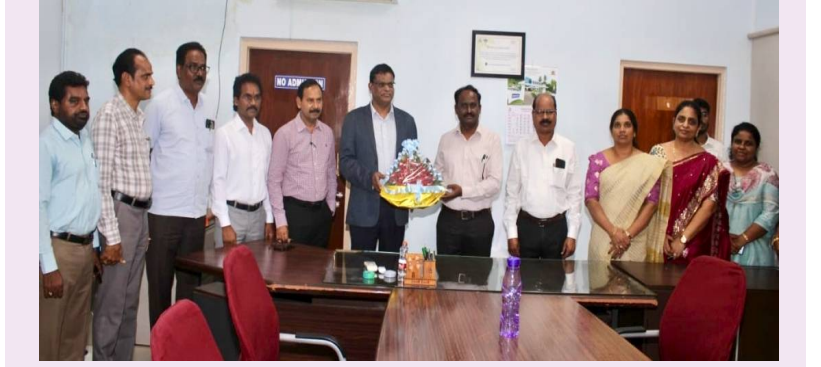
హన్మకొండ, 18 మే 2026(జై భీమ్ న్యూస్)