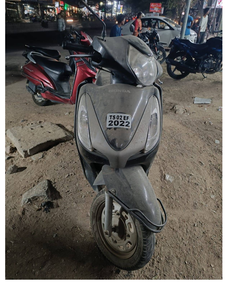
హనుమకొండ జిల్లా/హనువపర్తి, మే 18 (జై భీమ్ న్యూస్)

హనువపర్తి మండలం భీమారం బస్టాండ్ సమీపంలో గుర్తు తెలియని వ్యక్తులు ఓ స్కూటీని పార్క్ చేసి వెళ్లిపోవడంతో స్టానికుల్లో ఆందోళన నెలకొంది. స్టానికుల వివరాల ప్రకారం భీమారం బస్టాండ్ సమీపంలోని సచిన్ సెలూన్ ఎదురుగా గ్రే కలర్ కు చెందిన స్కూటీని సుమారు 15 నుంచి 20 రోజుల క్రితం కొందరు నిలిపివెళ్లినట్లు తెలుస్తోంది. అప్పటి నుంచి ఎవరూ వాహనాన్ని తీసుకెళ్లకపోవడంతో అనుమానాలు వ్యక్తమవుతున్నాయి. స్కూటీ రిజిస్ట్రేషన్ నెంబర్ టీఎన్ 03 ఈఎఫ్ 2022గా గుర్తించారు. వాహనం యజమాని ఎవరు..? ఎందుకు అక్కడ వదిలివెళ్లారు..? అనే విషయాలపై స్పష్టత లేకపోవడంతో స్టానికులు పోలీసులకు సమాచారం ఇవ్వాలని కోరుతున్నారు. ఇన్ని రోజులుగా ఒకేచోట వాహనం ఉండటంతో స్టానికులు అప్రమత్తమయ్యారు. ప్రజలు కూడా అనుమానాస్పద పస్తువులు, వాహనాలు కనిపించిన వెంటనే పోలీసులకు సమాచారం అందించాలని స్టానికులు సూచిస్తున్నారు.