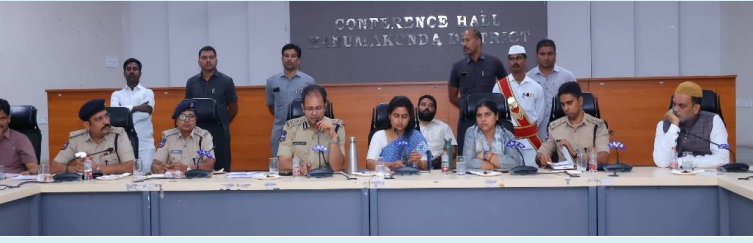
వరంగల్, 18 మే 2026(జై భీమ్ న్యూస్)