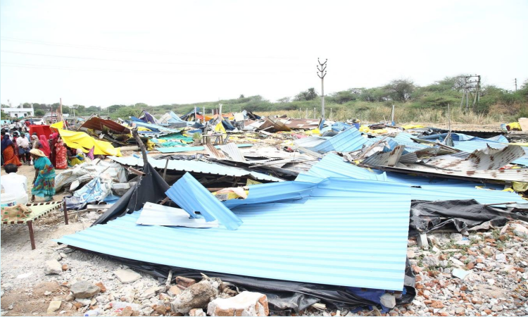
హన్మకొండ, 20 జూన్ 2026(జై భీమ్ న్యూస్)