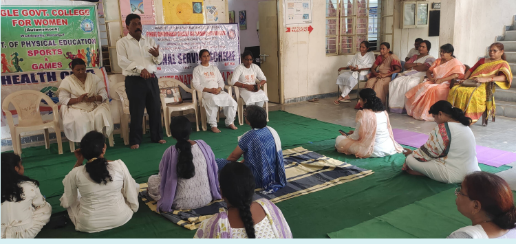
హన్మకొండ, 20 జూన్ 2026(జై భీమ్ న్యూస్)