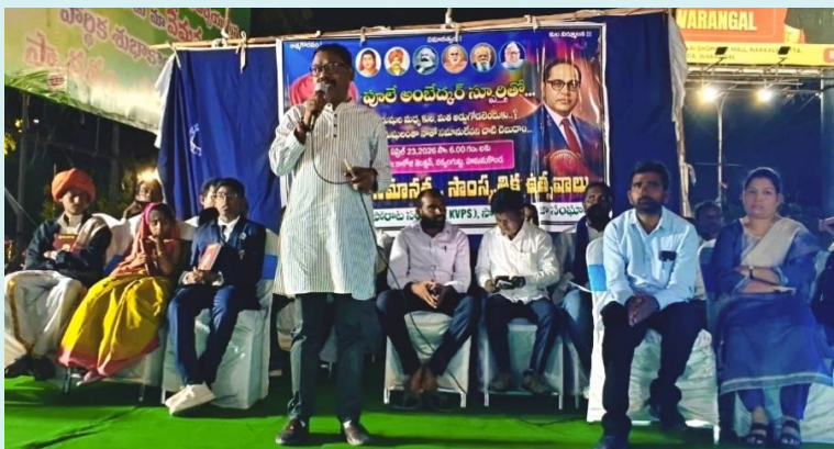
కాజీపేట, ఏప్రిల్ 23, 2026 (జై భీమ్ న్యూస్)

మాట మహానాడు గ్రేటర్ వరంగల్ అధ్యక్షుడు, మహనీయుల ఉత్సవ కమిటీ మాజీ చైర్మన్