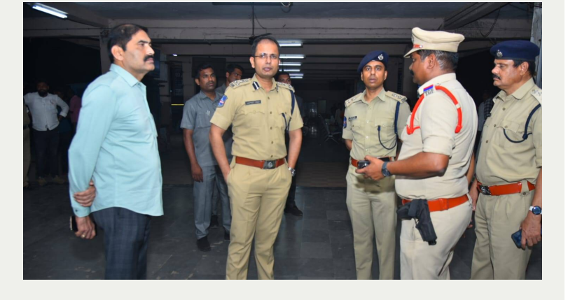
నర్సంపేట, 23 ఏప్రిల్ 2026 (జై భీమ్ న్యూస్)