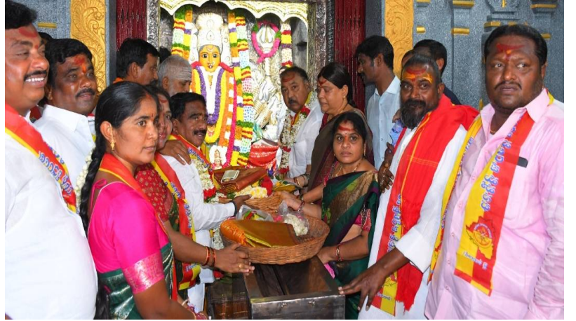
వరంగల్, 23 ఏప్రిల్ 2026 (జై భీమ్ న్యూస్)

శ్రీ భద్రకాళీ దేవస్థానంలో జరుగుతున్న శ్రీ భద్రకాళీ భద్రేశ్వరుల కళ్యాణ బ్రహ్మోత్సవాలు ఐదవ రోజుకు చేరుకొని భక్తిశ్రద్ధలతో కొనసాగుతున్నాయి. ఈ సందర్భంగా ఉదయం అమ్మవారికి నిత్యాస్తిక పూజలు నిర్వహించి, చతుస్థానార్చన అనంతరం సూర్యప్రభ వాహనంపై ఊరేగింపు నిర్వహించారు. సాయంకాలం హంస వాహనంపై అమ్మవారిని అలంకరించి భక్తులకు దర్శనమిచ్చారు. శాస్త్రాలలో జయచంద్ర దివాకరనేతధర్ అని అమ్మవారిని స్తుతించారు.