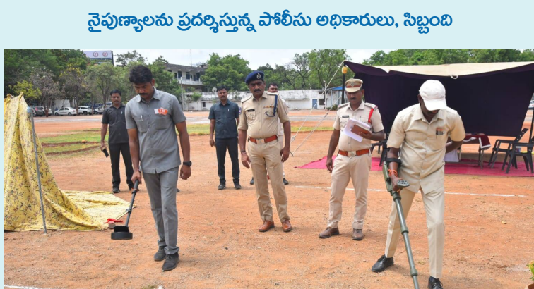
నైపుణ్యాలను ప్రదర్శిస్తున్న పోలీసు అధికారులు, సిబ్బంది