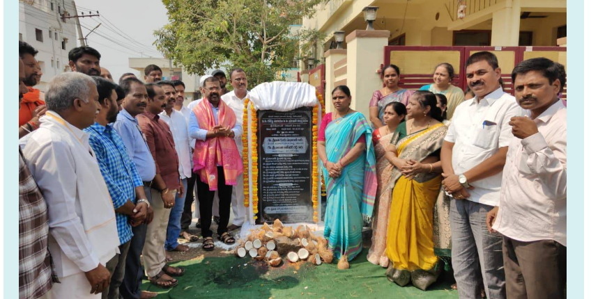
హనుమకొండ / జై భీమ్ న్యూస్ :