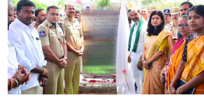
వేములవాడ, 24 ఏప్రిల్ 2026 (జై భీమ్ న్యూస్)