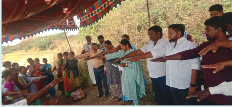
హన్మకొండ జిల్లా/ హోసన్ పర్తి, 24 ఏప్రిల్ 2026 (జై భీమ్ న్యూస్)