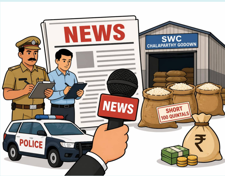
వరంగల్, 24 ఏప్రిల్ 2026 (జై భీమ్ న్యూస్)