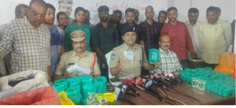
హైదరాబాద్ 24/ఏప్రిల్/2026 (జై భీమ్ న్యూస్)

హైదరాబాద్ నగరంలో భారీ ఎత్తున నకిలీ టీ పాడి కల్తీ జరుగుతున్నట్లు హచ్చిన విశ్వసనీయ సమాచారంతో, హెచ్-ఫాస్ట్ (హైదరాబాద్ ఫుడ్ అడ్వలర్షన్ సర్వీసెస్ టీమ్) నగరవ్యాప్తంగా 15 ప్రాంతాల్లో ఏకకాలంలో ఆకస్మిక దాడులు నిర్వహించింది.