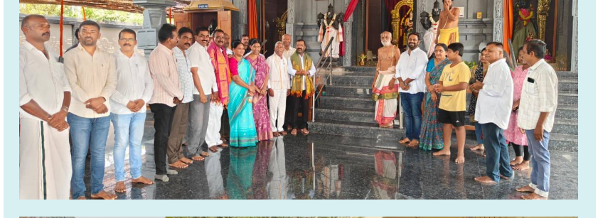
వరంగల్ పశ్చిమలో రూ.1.50 కోట్ల అభివృద్ధి పనులకు శంకుస్థాపన దశలవారిగా పనులు వేగవంతం..