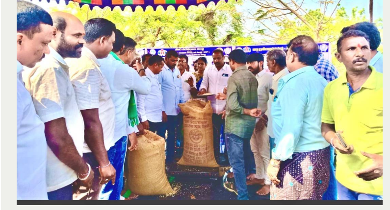
రైతులకు మద్దతు, న్యాయమైన ధరల కోసం ప్రభుత్వం ముందడుగు