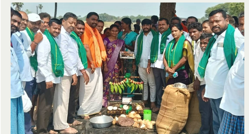
హాసన్ పల్లె, 24 ఏప్రిల్ 2026 (జై భీమ్ న్యూస్)