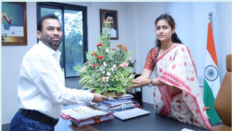
హనుమకొండ జిల్లా/పరకాల, 25 మే 2026(జై భీమ్ న్యూస్)