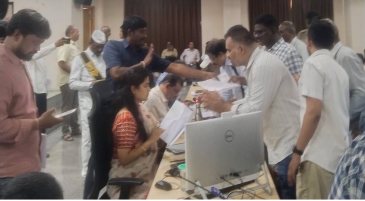
వ్యాఖ్యలతో దూషించారని నాయకులు తెలిపారు. సంబంధిత ఆసుపత్రులపై ప్రత్యేక తనిఖీ బృందాలతో సమగ్ర విచారణ జరిపి, బాధ్యులపై కఠిన చట్టపరమైన చర్యలు తీసుకోవాలని డిమాండ్ చేశారు. ఒకవేళ అధికారులు తక్షణ చర్యలు తీసుకోకపోతే బాధితుల తరపున “ఆమరణ నిరాహార దీక్ష” చేపడతామని హెచ్చరించారు.

ఆసుపత్రుల్లో అర్హత కలిగిన వైద్యుల పర్యవేక్షణ లేకుండానే శస్త్రచికిత్సలు నిర్వహిస్తున్నారని ఆరోపించారు. ముఖ్యంగా అపెండిసైటిస్, గర్భంపని సమస్యలతో వచ్చే పేద రోగులకు కనీస అర్హతలు లేని ఓ.టి. అసిస్టెంట్స్ చేత అపరేషన్లు చేయిస్తున్నారని పేర్కొన్నారు. ఇటువంటి చర్యలు ప్రజల ప్రాణాలకు ముప్పుగా మారాయని ఆందోళన వ్యక్తం చేశారు. అలాగే కొన్ని ఆసుపత్రులు, అనుబంధ డయాగ్నోస్టిక్ సెంటర్లు అల్లాసాండ్ స్టాన్సు, ఇతర వైద్య పరీక్షల పేరుతో ప్రభుత్వ నిబంధనలకు విరుద్ధంగా భారీ మొత్తంలో ఫీజులు వసూలు చేస్తూ నిరుపేద ప్రజలను అర్థికంగా దోచుకుంటున్నారని ఆరోపించారు. ఈ అక్రమాలను ప్రశ్నించినందుకు తమను కుల వివక్షతో కూడిన అవమానకర