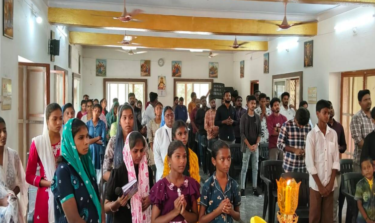
కడప, 29 మే 2026 (జై భీమ్ న్యూస్)