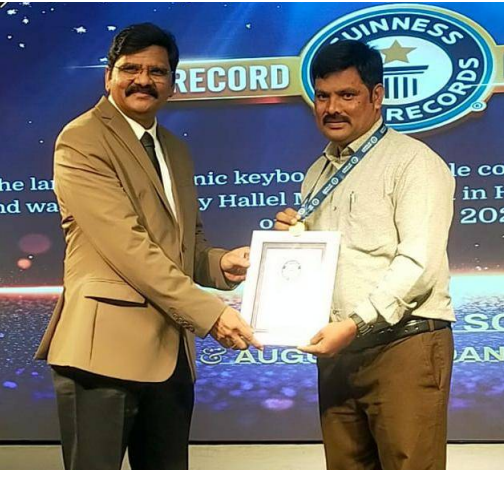
హన్మకొండ, 29 మే 2026 (జై భీమ్ న్యూస్)

హాలీవుడ్ మ్యూజిక్ సూల్ ఆధ్వర్యంలో గిన్నిస్ వరల్డ్ రికార్డ్ సాధించిన సందర్భంగా శుక్రవారం హైదరాబాద్లోని గచ్చిబౌలి విక్టరీ చర్చ్ ఆడిటోరియంలో "గిన్నిస్ అవీవర్స్ మీట్" ఘనంగా నిర్వహించారు. ఈ సందర్భంగా ప్రతిభ కనబర్చిన విద్యార్థులకు సర్టిఫికెట్లను అందజేసి సత్కరించారు. ఫిబ్రవరి 2, 2026న హైదరాబాద్లో గిన్నిస్ వరల్డ్ రికార్డ్స్ ప్రతినిధుల పర్యవేక్షణలో నిర్వహించిన భారీ కీబోర్డ్ సంగీత కార్యక్రమంలో 22 దేశాలకు చెందిన 2,000 మంది కీబోర్డ్ వాయిద్యకారులు గంటపాటు నిరంతరాయంగా వాయిస్తూ పాల్గొన్నారు. ఈ కార్యక్రమంలో ప్రతిభను ప్రదర్శించిన 777 మంది విద్యార్థులను ప్రత్యేకంగా