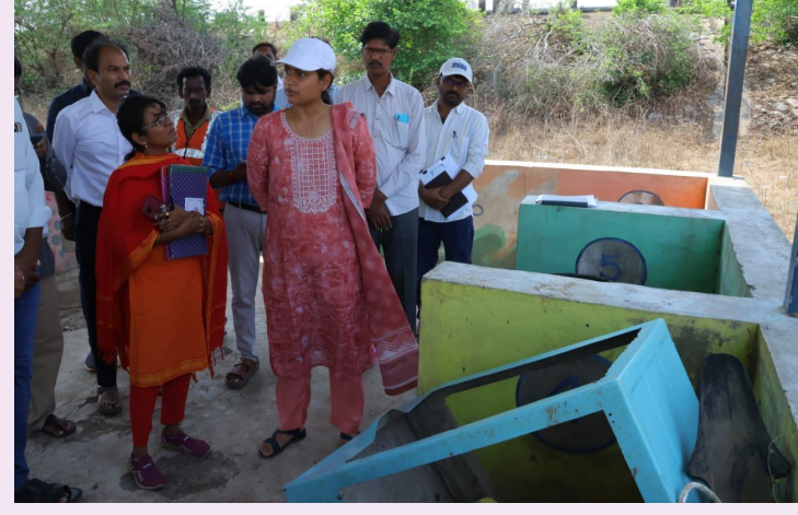
హన్మకొండ, 29 మే 2026 (జై భీమ్ న్యూస్)

డంపింగ్ నిర్వహణ, వ్యర్థాల సిగ్రిగేషన్ సమర్థవంతంగా ఉండాలి ప్రతి మండలంలో 3 నుంచి 5 మోడల్ గ్రామపంచాయతీల అభివృద్ధికి కార్యాచరణ రూపొందించాలి జిల్లా కలెక్టర్ చాహాట్ బాజ్ పాటు