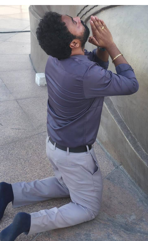
హైదరాబాద్ 125 అడుగుల అంబేద్కర్ విగ్రహం వద్ద భావోద్వేగ వ్యాఖ్యలు విగ్రహం బహుజన ఆత్మగౌరవానికి ప్రతీకగా నిలుస్తోందని వెల్లడి అంబేద్కర్ మార్గం సమాజ లక్ష్యాలకు వెలుగుబాటగా మారందని అభిప్రాయం రాజ్యాంగ హక్కుల సాధన కోసం నిరంతర పోరాటమే లక్ష్యమని స్పష్టం చివరి శ్వాస వరకు సామాజిక న్యాయం కోసం కృషి చేస్తానని సంకల్పం హైదరాబాద్, 29 మే 2026 (జై భీమ్ న్యూస్)