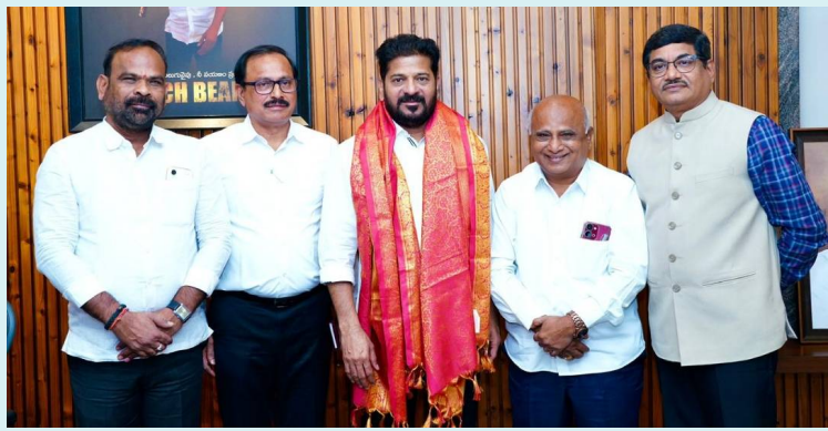
హైదరాబాద్, 29 మే 2026 (జై భీమ్ న్యూస్)

రాష్ట్ర సమాచార హక్కు (ఆర్టిఐ) కమిషన్ ప్రధాన కమిషనర్, కమిషనర్లు శుక్రవారం ముఖ్యమంత్రి ఎ. రేవంత్ రెడ్డిని జూబ్లీహిల్స్లోని ఆయన నివాసంలో మర్యాదపూర్వకంగా కలిశారు. కమిషన్లో భాగ్యతలు చేపట్టి ఏడాది పూర్తి చేసుకున్న సందర్భంగా ముఖ్యమంత్రిని కలిసిన ప్రతినిధులు రాష్ట్రంలో సమాచార హక్కు చట్టం అమలు, కమిషన్ నిర్వహిస్తున్న కార్యకలాపాలు, ప్రజలకు సమాచార హక్కు సేవల అందుబాటుపై వివరించారు. గత ఏడాది కాలంలో కమిషన్ చేపట్టిన కార్యక్రమాలు, ప్రజల నుంచి అందిన దరఖాస్తులు, వాటి పరిష్కారానికి తీసుకున్న చర్యల గురించి కూడా ముఖ్యమంత్రికి నివేదించారు. సమాచార హక్కు చట్టం ప్రజాస్వామ్య వ్యవస్థలో పారదర్శకత, జవాబుదారీతనాన్ని పెంపొందించడంలో కీలక పాత్ర పోషిస్తోందని ఈ సందర్భంగా అభిప్రాయాలు వ్యక్తమయ్యాయి. ప్రభుత్వ సేవల్లో మరింత పారదర్శకత తీసుకురావడంతో పాటు ప్రజలకు సమాచార హక్కు చట్టంపై అవగాహన పెంచేందుకు కమిషన్ చేపడుతున్న చర్యలను కూడా వివరించారు. ముఖ్యమంత్రిని కలిసిన వారిలో రాష్ట్ర సమాచార హక్కు ప్రధాన కమిషనర్ డి. చంద్రశేఖర్ రెడ్డి, కమిషనర్లు పీవీ శ్రీనివాస్, బోర్డి ఆయోధ్య రెడ్డి, దేశాల భూపాల్ ఉన్నారు. ఈ సందర్భంగా ముఖ్యమంత్రి వారికి శుభాకాంక్షలు తెలియజేసి, సమాచార హక్కు చట్టం అమలులో కమిషన్ మరింత సమర్థవంతంగా పనిచేసి ప్రజలకు మెరుగైన సేవలు అందించాలని ఆకాంక్షించినట్లు సమాచారం.