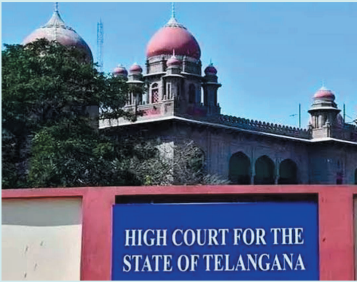
హైదరాబాద్ జై భీమ్ న్యూస్

కంచ గచ్చిబొలి భూముల వ్యవహారంపై హైకోర్టులో పిటిషన్ దాఖలైంది, ఆ భూములను జాతీయ ఉద్యానవనంగా ప్రకటించాలని కోరుతూ పట ఫౌండేషన్ అనే స్వచ్ఛంద సంస్థ తెలంగాణ హైకోర్టులో మంగళవారం పిటిషన్ దాఖలు చేసింది. హైదరాబాద్ హైకోర్టులో సర్వే నిర్వహించలేదని ఆ సంస్థ రిజిస్ట్రార్ ప్రకటించారు. ఉమ్మడి ఆంధ్రప్రదేశ్ రాష్ట్రం లో ఈ 400 ఎకరాలను 2003లో అప్పటి ప్రభుత్వం ఐఎంజీ భారత్ అనే కంపెనీకి కేటాయించింది. అయితే ఈ భూమిపై న్యాయపోరాటం చేసి ఈ భూమిని స్వాధీనం చేసు కున్నామని సీఎం రేవంత్ రెడ్డి ఇటీవల ప్రకటించారు. అయితే ఈ భూమిలో హైకోర్టుకు ఎలాంటి సంబంధం లేదని కూడా ప్రభుత్వం చెబుతోంది. ఈ భూమిని విక్రయించేందుకు ప్రభుత్వం ప్రయత్నిస్తోందని వివక్షలు ఆరోపిస్తున్నాయి. హైకో సీ యూలోని విద్యార్థి సంఘాలు కూడా ఈ భూ మల విక్రయాన్ని నిలిపి వేయాలని డిమాండ్ చేస్తూ ఆందోళనకు దిగారు.