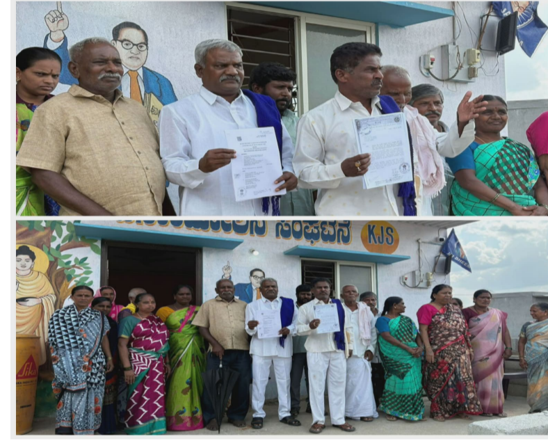
గందరగోళం సృష్టించకూడదు. నియమానుసారంగా హైకోర్టు ఉత్తర్వులు మరియు ఇంటి కేటాయింపు అని సంస్థలు చేస్తోంది," అని స్పష్టం చేశారు.