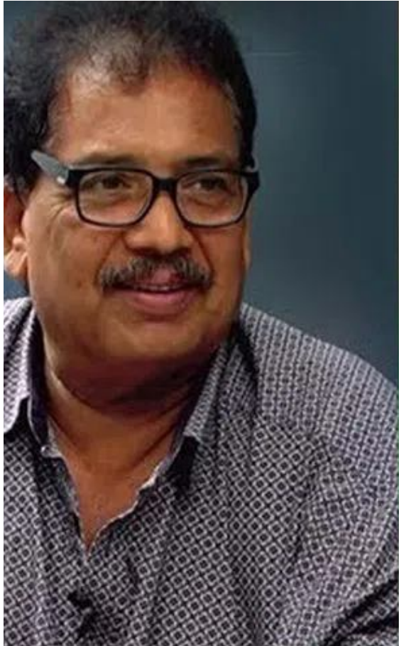
ఆ రోజుల్లో ప్రచారం జరిగిందే. ఈ విషయంపై ఆయనను ప్రశ్నించగా.. ఆయన స్పందించలేదు. అదంతా గతమని.. చాలా ఏళ్లనాటి పాత కథ

దర్శకుడు వంశీ గురించి ప్రత్యేకంగా పరిచయం అవసరం లేదు. రచయిత గాను ఆయనకు మంచి పేరున్నది. ఆయన సినిమాలకు ఇప్పటికీ ఎంతో మంది అభిమానులు ఉన్నారు. సీనియర్ నటి భానుప్రియను సినిమా ఇండస్ట్రీకి పరిచయం చేసింది ఆయనే. ఆయన దర్శకత్వంలో భానుప్రియ సితార, అన్వేషణ, ఆలాపన తదితర సినిమాలో నటించింది. ఈ సినిమాలు ఎవర్ గ్రీన్ గా నిలిచిపోయాయి. తాజాగా ఓ మీడియా ఇంటర్వ్యూలో దర్శకుడు వంశీ పాల్గొన్నారు. ఈ సందర్భంగా ఆయన అనేక అంశాలపై ప్రస్తావించారు. కెరియర్ మొదటలో ఏ సినిమా చేస్తే బాగుంటుందనే విషయంలో తన సలహాలు, సూచనలను భానుప్రియ అడిగి తెలుసుకుంటుండేదని చెప్పారు. గ్లామర్స్, మోడ్రన్ లుక్ లో కనిపించే రోల్స్ తనకు రావడం లేదనే అంశాన్ని గుర్తొచ్చి వంశీ గుర్తు చేసుకున్నారు. దాంతో అన్వేషణ మూవీలో మోడ్రన్ గా కనిపించే అమ్మాయిలా చూపించానన్నారు. అప్పటి నుంచే ఆ తరహా పాత్రలు వచ్చాయని భానుప్రియ చెప్పిందని తెలిపారు. భానుప్రియ చూసి దాదాపు 35 సంవత్సరాలు అవుతుందని తెలిపారు. ఇదిలా ఉండగా.. భానుప్రియను పెళ్లి చేసుకోవాలని డైరెక్టర్ వంశీ భావించినట్లు