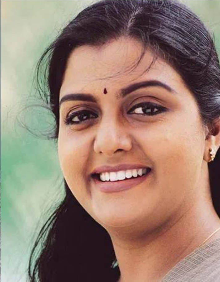
అంటూ దాటవేశారు. ఈ రోజు వరకు నాకు ఎవరూ లేరని.. తన భార్య కూడా చనిపోయిందని వాపోయారు. ఇద్దరు కూతుళ్లు ఉన్నారు.. ఒకరు హైదరాబాద్