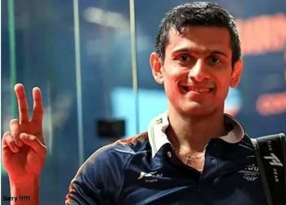
జై భీమ్ న్యూస్, సెక్యూరిటీ :

భారత స్టార్ స్వాష్ ఆటగాడు సౌరవ్ ఘోషల్ ప్రాఫెషనల్ స్వాష్ కు వీడోళ్లు పలికాడు. 37 ఏళ్ల సౌరవ్ సోషల్ మీడియా వేదికగా ఈ విషయాన్ని వెల్లడించాడు. 22 ఏళ్ల సుదీర్ఘ కెరీర్ కు గుడ్ బై చెబుతున్నట్లు ఆ ప్రకటనలో తెలిపాడు. '22 ఏళ్ల క్రితం నా కెరీర్ మొదలైంది. అప్పుడు ప్రాఫెషనల్ స్వాష్ లో సుదీర్ఘ కాలం ఆడతానని అనుకోలేదు. కానీ, ప్రతి దానికి ముగింపు ఉంటుంది. ప్రాఫెషనల్ స్వాష్ అసోసియేషన్ (పిఎస్ఎ) కు రిటైర్మెంట్ ప్రకటిస్తున్నా' అని తెలిపాడు. అయితే, ఇది స్వాష్ కు పూర్తిగా వీడోళ్లు పలికినట్లు కాదని, తాను దేశం తరపున మరికొంత కాలం ఆడతానని పేర్కొన్నాడు. కాగా, ఘోషల్ తన కెరీర్ లో 10 పిఎస్ఎ ట్రైటిల్స్ సాధించాడు. అంతేకాకుండా, టాప్-10 వరల్డ్ ర్యాంకింగ్ లో నిలిచిన ఏకైక భారత ఆటగాడు అతనే. వరల్డ్ డబుల్స్ చాంపియన్ షిప్-2022లో మిక్స్డ్ డబుల్స్ కేటగిరీలో సౌరవ్ స్వర్ణం సాధించాడు. అదే ఏడాది కామన్వెల్త్ గేమ్స్ లో మిక్స్డ్ డబుల్స్, సింగిల్స్ కేటగిరీల్లో కాంస్యం సాధించగా.. ఆసియా క్రీడల్లో టీమ్ ఈవెంట్ లో స్వర్ణం, సింగిల్స్ లో రజతం గెలుచుకున్నాడు.