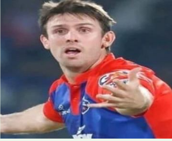
జై భీమ్ న్యూస్, సెక్యూరిటీ :

ప్రస్తుతం ఇండియా లో ఇండియన్ ప్రీమియర్ లీగ్ హడావిడి కొనసాగుతోంది. ఇక ఎక్కడ చూసినా కూడా క్రికెట్ ప్రేక్షకులందరూ కూడా మ్యాచ్ చూస్తూ తెగ ఎంటర్టైన్మెంట్ పొందుతూ ఉన్నారు. ఒకరకంగా చెప్పాలంటే ఇండియా మొత్తం క్రికెట్ వండుగ జరుగుతుంది అని చెప్పాలి. చిన్న పెద్ద అనే తేడా లేకుండా ప్రతి ఒక్కరు టీవీలకు అతుక్కు పోయి క్రికెట్ మ్యాచ్ ను వీక్షిస్తూ ఉన్నారు. ఇంకొంత మంది ఇది నేరుగా స్టేడియం కు వెళ్లి మ్యాచ్ వీక్షించడానికి ఆసక్తిని కనపరుస్తూ ఉన్నారు అని చెప్పాలి. ఎట్టి పరిస్థితుల్లో టైటిల్ గెలవాల్సి అనే లక్ష్యం తో అటు తెగ కష్టపడి పోతున్నాయి అన్ని టీమ్స్ అన్న విషయం తెలిసిందే. అయితే ఇక ఇలా టైటిల్ గెలిచేందుకు తీవ్రంగా కష్టపడుతున్న కొన్ని టీమ్స్ కి మాత్రం ఊహించని ఎదురు దెబ్బలు తగులుతున్నాయి. ఎందుకంటే జట్టులో ఉన్న కీలక ఆటగాళ్లు గాయం బారిన పడుతూ చివరికి జట్టుకు దూరమవుతున్న పరిస్థితి కనిపిస్తుంది. ఇంకొన్ని టీమ్స్ కి ఇక వ్యక్తిగత కారణాలతో ప్లేయర్లు ఇక జట్టుకు దూరమవుతున్నారు అని చెప్పాలి. ఇలా కీలకమైన ప్లేయర్లు జట్టుకు దూరమవుతున్న నేపథ్యంలో ఆయా టీమ్స్ యొక్క పూర్వం లు తారుమారు అవుతూ ఉన్నాయి. అయితే ఇప్పటికే అడపాదడప విజయాలు సాధిస్తూ పరచాలేదు అనిపిస్తున్న ఢిల్లీ క్యాపిటల్స్ జట్టుకి ఇప్పుడు మరో బిగ్ షాక్ తగిలింది. ఏకంగా ఆ టీం స్టార్ ఆల్ రౌండర్ మిచెల్ మార్ష్ ఐపీఎల్ 17వ సీజన్ మొత్తానికి దూరమయ్యాడు. తొడ కండరాల గాయానికి చికిత్స కోసం అతను కొన్ని రోజుల క్రితం ఆస్ట్రేలియా కు వెళ్లారు. అయితే గాయం నుంచి పూర్తిగా కోలుకోక పోవడంతో ఇక ఈ సీజన్ మొత్తానికి దూరమయ్యాడు. కాగా ఈ నెల మూడవ తేదీన కోల్కతాలో జరిగిన మ్యాచ్లో చివరి సారిగా ఐపీఎల్ ఆడాడు మిచెల్ మార్ష్.