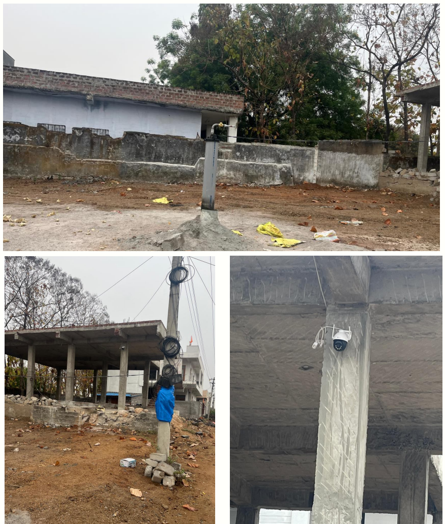
మహానగరంలో మాయదారికట్టాలు అతి త్వరలో

హనుమకొండ, జై భీమ్ న్యూస్: వరంగల్ మహానగరం కట్టాలకు పెట్టింది పేరుగా మారుమోగిపోతుంది. భూములో కాడ కట్టాలు మరోకాడ.. చూడడానికి చిత్ర విచిత్రంగావుంది. ఇట్టి కట్టా భూమిలో గత ఐదేళ్లలో అధికారి ప్రస్తుత బజెపి ఏ రంగ నాథ్ తన పోలీస్ అధికార సిబ్బందిచే విచారణ జరిపించి మహిళా భూమిలో రక్షణ కల్పిస్తే నేడు అదే భూమిలో సీసీ కెమెరాల నిధా మధ్యలో చూడముచ్చటైన కట్టా జరుగుతుండడం కొనమెరుపు. తెలంగాణ రాష్ట్ర ముఖ్యమంత్రి సీఎం రేవంత్ రెడ్డి భూకట్టాలపై కఠినంగా వ్యవహరిస్తూ సామాన్యులకు రక్షణ కల్పించాలని రాష్ట్రవ్యాప్తంగా ప్రభుత్వ అధికారులకు ఆదేశాలు జారీచేస్తే భూకట్టాదారులు వాటిని పట్టించుకోకుండా రాజకీయ నాయకుల పలుకుబడితో విచ్చలవిడి భూకట్టాలకు తెరలేపున్నారు. వివరాలలోని వెబ్ సైట్ హనుకొండ వద్దపల్లి ఫిల్డర్ బెడ్ ప్రాంతంలో పశ్చిమ ఎమ్మెల్యే నాయిని రాజేందర్ రెడ్డిని కాలనీవాసులు వేడుకుంటున్నారు.