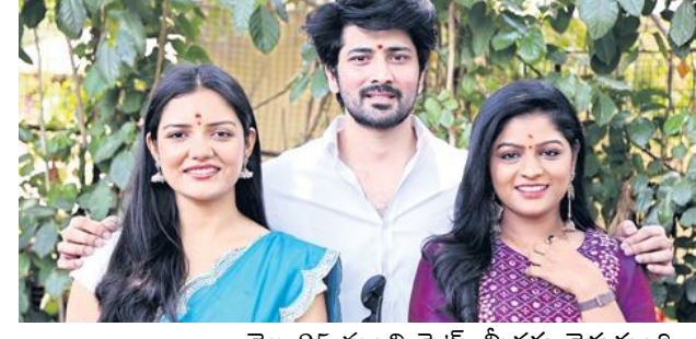
నెల 25 నుంచి సెట్స్ మీదకు వెళుతుంది. బదు షెడ్యూల్స్ లో సినిమాని పూర్తి చేసి డీపావళికి సినిమాని విడుదల చేస్తున్నాం' అని దర్శకుడు పాలిక్ చెప్పారు.

చెప్పారు. నిర్మాత రావుల రమేష్ మాట్లాడుతూ, 'ఇటీవలే కాలకేరు ప్రభాకర్ తో కలిసి 'రా'ద్రూపాయ నమ:' చిత్రాన్ని విడుదల చేశాం. ఆ చిత్రానికి మంచి పేరు వచ్చింది. ఈ చిత్రానికి ఎక్కువ థియేటర్లు లభిస్తాయని ఆశిస్తున్నా' అని అన్నారు. 'నా మిత్రుడు ఎస్.ఆర్.పి. కథతో ఈ సినిమా చేస్తున్నాం. పాటలు బాగా వచ్చాయి. వచ్చే