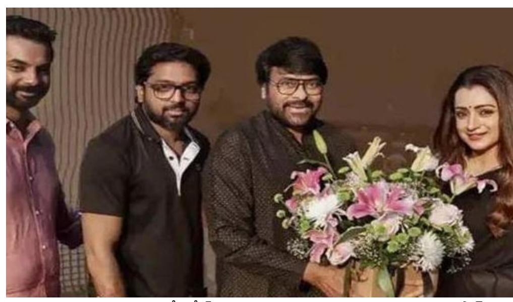
కాసుకగా ఈ మూవీ రిలీజ్ అవుతుండటం గమనార్హం. చిరంజీవి విశ్వంభర సినిమా విడుదలైన తర్వాత కొత్త సినిమాలను ప్రకటించే అవకాశం ఉంది. ఈ విశ్వంభర సినిమా పాన్ ఇండియా మూవీగా రిలీజ్ కానుంది. విశ్వంభర సినిమా కథ, కథనం చాలా కొత్తగా ఉంటాయని తెలుస్తోంది.

నిర్మాతలు ఈ మూవీని పాన్ ఇండియా లెవెల్ లో భారీ స్టాయిలో నిర్మిస్తుండటం గమనార్హం. ఈ సినిమాలో దొరబాబు అనే రోల్ లో మెగాస్టార్ చిరంజీవి కనిపించను న్నారు. మెగాస్టార్ చిరంజీవి ఈ సినిమాకు ఏకంగా 60 కోట్ల రూపాయల రేంజ్ లో రెమ్యునరేషన్ తీసుకుంటున్నారు. సీనియర్ మ్యూజిక్ డైరెక్టర్ ఎం.ఎం.కీరవాణి ఈ సినిమాకు మ్యూజిక్ అందిస్తున్నారు. చిరంజీవి కీరవాణి కాంచినేషన్ లో చాలా సంవత్సరాల తర్వాత సినిమా తెరకెక్కుతుండటంతో మెగాస్టార్ ఫ్యాన్స్ ఎంతగానో సంతోషిస్తున్నారు. 2025 సంవత్సరం సంక్రాంతి పండుగ