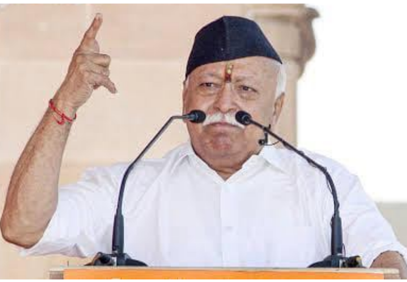
మేము చేయబోతున్నాము అని అన్నారు. ఆర్ఎస్ఎస్ తన కొన్ని లక్ష్యాలను సాధించడానికి వంద ఏళ్లు పట్టింది. ఇది నిజంగా మన విజయమని, 2000

వదోదర, జై భీమ్ న్యూస్ : ఇప్పుడున్న పరిస్థితుల్లో రాజ్యాంగాన్ని మార్చే మాట ఆడితే బీజేపీకి నష్టం. అందుకే సైలెంట్ గా సాధించాలి, ఇప్పుడు కాస్త ఓపిక పట్టాలి అని వదోదరలో జరిగిన ఆర్ఎస్ఎస్ కార్యక్రమంలో పాల్గొన్న ప్రస్తుత ఆర్ఎస్ఎస్ అధినేత మోహన్ భగవత్ అన్నారు. ఆయన మాట్లాడుతూ ఆర్ఎస్ఎస్ ఆవిర్భవించి వంద ఏళ్లు అవుతుంది. కానీ మనం వంద ఏళ్లు ఆర్ఎస్ఎస్ చేరుకో జరుపుకోవాలని ప్రయత్నించినా సాధించలేదు. కావున, ఈ చేరుకోవడం మరొకరికంటే కాలం ముందుకు తీసుకెళ్ళాల్సిన అవసరం ఉందని, హిందూ రాష్ట్ర స్థాపన తర్వాతనే సంఘ శతాబ్ది ఉత్సవాలను ఉత్సాహంగా జరుపుకుంటామని తెలియజేసే పనిని