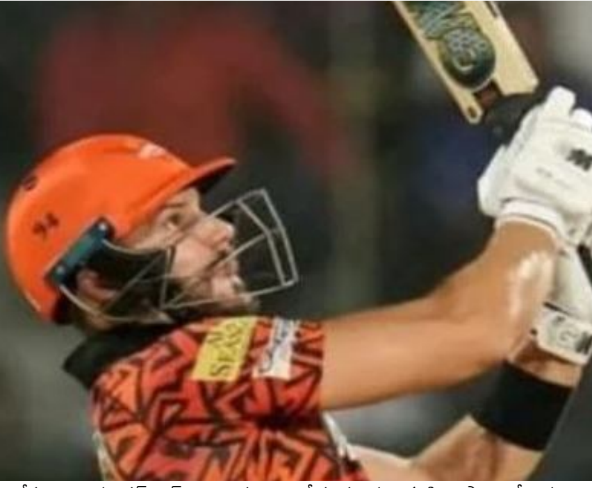
కోహ్లా పై ఉన్నారు. సన్రైజర్స్ ఆటగాళ్ల ఆట తీరు మందు ఇక టీ20 ఫార్మాట్లో ఉన్న

సన్రైజర్స్ హైదరాబాద్ జట్టు పై ఒకప్పుడు ఎవరికీ పెద్దగా అంచనాలు ఉండేవి కాదు. ఇక టైటిల్ ఫేవరెట్ గా బరిలోకి దిగిన సన్రైజర్స్ బాగా రాణిస్తుంది అని నమ్మకం కూడా చాలా మందిలో ఉండేది కాదు. ఎందుకంటే కేవలం బౌలింగ్ విభాగంలో మాత్రమే పటిష్టంగా కనిపించే సన్రైజర్స్.. బ్యాటింగ్ మాత్రం తేలిపోతూ ఉండేది. కానీ 2024 ఐపీఎల్ సీజన్లో మాత్రం పరిస్థితులు పూర్తిగా మారిపోయాయి. ఏకంగా మహామహా జట్లను సైతం వణికించే విధంగా సన్రైజర్స్ పటిష్టంగా మారిపోయింది. ఒకరకంగా బ్యాటింగ్ ఊపకొత్త అంటే ఎలా ఉంటుందో ఈ సీజన్లో సన్రైజర్స్ బ్యాటర్లు చూపిస్తున్నారు. ఏకంగా ప్రత్యర్థి బౌలర్లు ఎందుకు బౌలర్లం అయ్యారో అని బాధపడే విధంగా విధ్వంసాన్ని సృష్టిస్తున్నారు. ఏకంగా వీర విహారం చేస్తూ ఎన్నో రికార్డులను బద్దలు