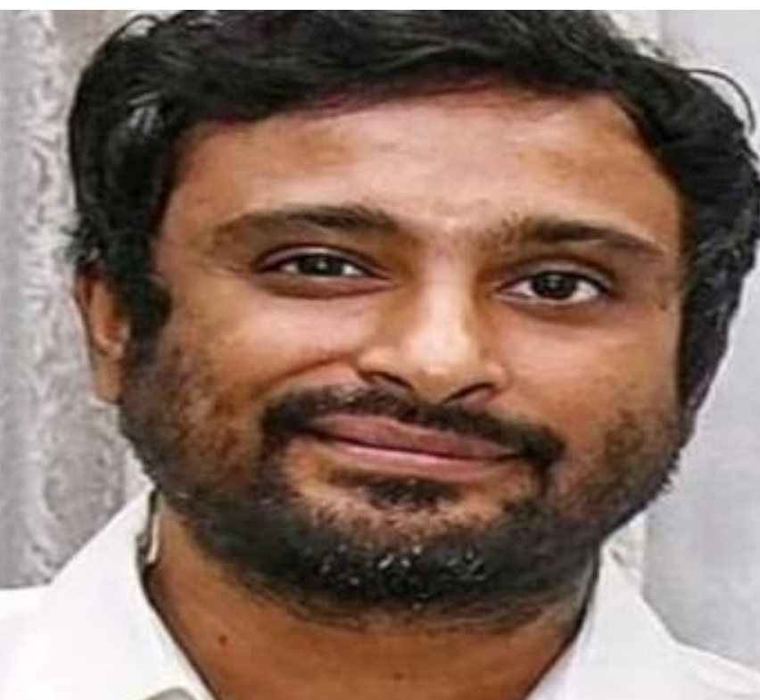
రూల్ పై తెగ చర్చ జరుగుతుంది అన్న విషయం తెలిసిందే. ఈ రూల్ కారణంగా ఎంతో మంది ఆటగాళ్లకి అన్యాయం జరుగుతుంది అంటూ మాజీ షేయర్లతో పాటు ప్రస్తుత షేయర్లు కూడా అభిప్రాయం వ్యక్తం చేశారు. ఈ రూల్ వల్ల ఆటగాళ్లు కేవలం బ్యాటింగ్ కి మాత్రమే పరిమితం అవుతున్నారని తర్వాత బౌలింగ్ చేసేందుకు అవకాశం రావడం లేదు అంటూ చెబుతున్నారు.

ఇంటర్నేషనల్ క్రికెట్లో ఎక్కడా లేని ఒక రూల్ అటు ఐపీఎల్ లో కొనసాగుతుంది అన్న విషయం తెలిసిందే. అదే ఇంపాక్ట్ షేయర్ రూల్. ఇంటర్నేషనల్ క్రికెట్లో సాధారణంగా ఒక ఆటగాడు గాయపడినప్పుడు.. అతనికి సబ్ స్టిట్యూట్ గా మరో ఆటగాడిని మైదానంలోకి తీసుకువచ్చేందుకు అవకాశం ఉంటుంది. కానీ ఇలా వచ్చిన ఆటగాడు కేవలం ఫీల్డింగ్ చేయడానికి మాత్రమే ఛాన్స్ ఉంటుంది. అయితే ఐపీఎల్ లో మాత్రం ఇంపాక్ట్ షేయర్ అనే రూల్ని తీసుకువచ్చి సబ్స్టిట్యూట్ అనే రూల్ కి మెరుగులు దిద్దింది బీసీసీఐ. ఇక ఈ రూల్ కింద బౌలర్ ని లేదా బ్యాట్స్మెన్ ని మ్యాచ్ మధ్యలో మార్చుకునేందుకు అవకాశం ఉంటుంది. ఇలా సబ్స్టిట్యూట్ గా వచ్చిన షేయర్ బ్యాటింగ్ బౌలింగ్ చేసేందుకు అవకాశం ఉంటుంది. అయితే గత కొంతకాలం నుంచి ఈ