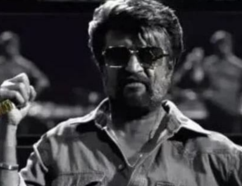
న్వారో అలా చూపించాడు. జైలర్ అయితే ఆ తర్వాత కూలీగా వస్తున్న లోకేష్ మూవీ రజనీకాంత్ ఫ్యాన్స్ ఆకలి తీర్చేసింది. కనకరాజ్ రజనీ కాంత్ ని డిఫరెంట్ గా

జైలర్ మూవీతో తిరిగి సూపర్ ఘాంట్ కి వచ్చిన సూపర్ స్టార్ రజనీకాంత్ తన తరువాత సినిమా కూలీతో డబుల్ ఎనర్జీతో కనిపిస్తున్నాడు. లోకేష్ కనకరాజ్ డైరెక్షన్ లో తెరకెక్కుతున్న కూలీ మూవీ నుంచి రీసెంట్ గా వచ్చిన టీజర్ చూస్తే రజనీ కాంత్ తో లోకేష్ కనకరాజ్ మరో సూపర్ హిట్ ఇచ్చేందుకు రెడీగా ఉన్నాడని అనిపిస్తుంది. లోకేష్ సినిమాటిక్ యూనివర్స్ తో ముడిపడే ఈ కూలీ సినిమా ఉంటుందా లేదా అన్నది తెలియాల్సి ఉంది. అయితే లోకేష్ సినిమా అనే విషయం పక్కన పెడితే కూలీ సినిమా మీద జైలర్ ఇంఫాక్ట్ ఎంత వరకు ఉంటుంది అని సూపర్ స్టార్ రజనీ కాంత్ ఫ్యాన్స్ ఎగైట్ అవుతున్నారు. ఒక స్టార్ హీరో సినిమా సూపర్ హిట్ పడితే ఆ సినిమాకి సంబంధించి ఇంఫాక్ట్ అనేది తరువాత సినిమా మీద ఉంటుంది. జైలర్ మూవీతో నెల్లూ సూపర్ స్టార్ ఫ్యాన్స్ ఆయన్ను ఎలా చూడాలని అనుకుంటు