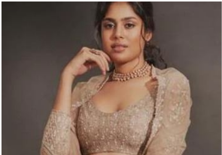
నటించినప్పటికీ ఏ మూవీ కూడా ఆ స్థాయి విజయాన్ని అందుకోలేదు. దానితో ఈ బ్యూటీ కూడా ఈ సినిమాపై బోలెడన్ని ఆశలు పెట్టుకుంది. మరి ఈ సినిమా ఫెరియా కి ఏ స్థాయి విజయాన్ని అందిస్తుందో చూడాలి.

జీవితం ఎంతో ఆనందంగా ఉంటుంది. అందుకే ప్రేమించిన వ్యక్తినే పెళ్లి చేసుకుంటాను అని ఈ బ్యూటీ చెప్పుకొచ్చింది. ఇకపోతే తాజాగా ఈమె అల్లరి నరేష్ హీరో గా రూపొందిన ఆ ఒక్కటి అడక్కు అనే సినిమాలో హీరోయిన్ గా నటించింది. చాలా సంవత్సరాల తర్వాత అల్లరి నరేష్ నటించిన ఫుల్ లెన్స్ కామెడీ ఎంటర్టైనర్ మూవీ కావడంతో ఈ సినిమాపై తెలుగు సినీ ప్రేమికులు మంచి అంచనాలు పెట్టుకున్నారు. ఈ మూవీ మే 3 వ తేదీన థియేటర్ లలో విడుదల కానుంది. ఈ సినిమా విడుదల తేదీ దగ్గర పడడంతో ప్రస్తుతం ఈ మూవీ యూనిట్ వరస ఇంటర్వ్యూ లలో , టీవీ షో లలో పాల్గొంటూ ఈ మూవీ ని ప్రమోట్ చేస్తూ వస్తున్నారు. ఇకపోతే ఫరియా కూడా జాతి రత్నాలు మూవీ తర్వాత అనేక సినిమాలలో