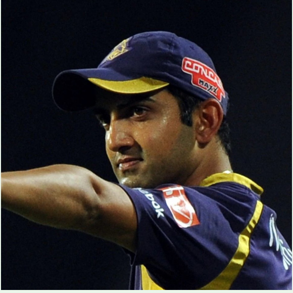
జై భీమ్ న్యూస్, సాక్షి: