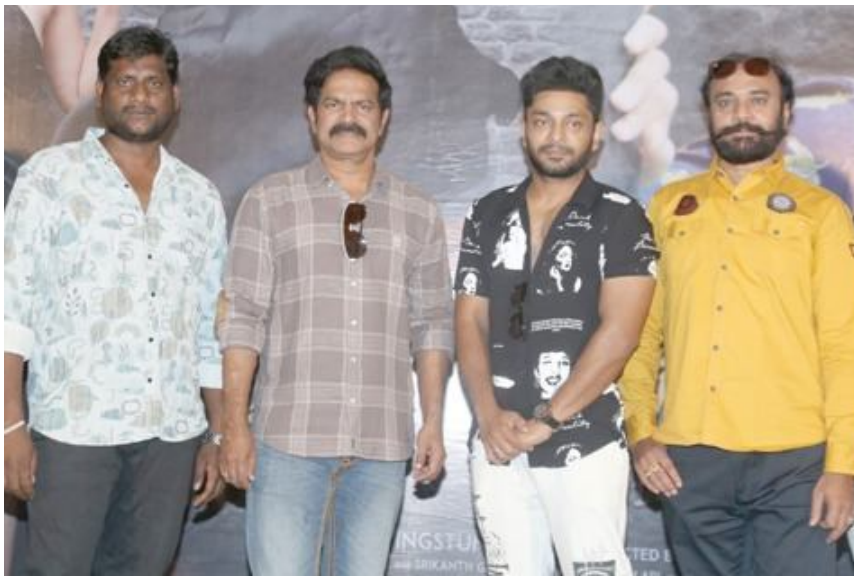
జై భీమ్ న్యూస్, సినిమా :

పక్కా ఫ్యామిలీ ఎంటర్టైన్ మెంట్ సరేష్ నటించిన అవుట్ అండ్ అవుట్ ఫ్యామిలీ ఎంటర్టైన్ 'ఆ ఒక్కటి అడక్కు'. మల్లి