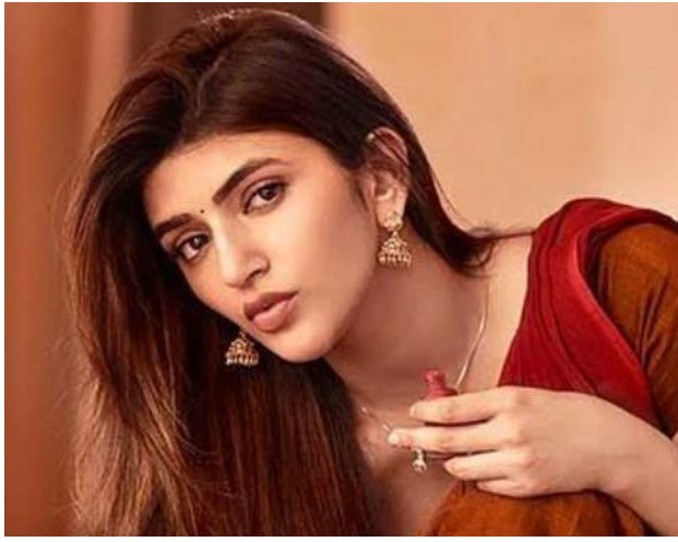
జై భీమ్ న్యూస్, సినిమా :

కోలీవుడ్ టాప్ స్టార్లలో ఒకరైన విజయ్ సినిమాలో అవకాశం అంటే ఏ హీరోయిన్ మాత్రం నో అంటుంది. కానీ టాలీవుడ్ యువ హీరోయిన్ శ్రీలీల మాత్రం నో చెప్పేసింది. అందుకు కారణం లేకపోలేదు. వివరాల్లోకి వెళితే.. విజయ్ హీరోగా వెంకట్ ప్రభు దర్శకత్వంలో తెరకెక్కుతున్న చిత్రం 'గోల్డ్'. విజయ్ పాటలకల్ ఎంట్రి ఇస్తుండడంతో తన కెరీర్లో ఇదే చివరి చిత్రం అనే ప్రచారం జరుగుతోంది. దీంతో అంచనాలు ఏ స్థాయిలో ఉన్నాయి. ఇందులో స్పెషల్ సాంగ్ కోసం శ్రీలీలను సంప్రదించారట. అయితే ఈ ఆఫర్ను ఆమె సున్నితంగా తిరస్కరించింది. అజిత్ సినిమా 'గుడ్ బ్యాడ్ అగ్గీ'తో ఆమె కోలీవుడ్ ఎంట్రి ఇవ్వబోతోంది. అదే టైమ్లో ఈ ఆఫర్ వచ్చింది. ఐటం సాంగ్తో ఎంట్రి ఇవ్వడం కంటే హీరోయిన్గా కోలీవుడ్కు పరిచయం అవడం ఆమె కెరీర్ కు ప్లస్ అవుతుంది. అదీకాక గతంలో పలు ఇంటర్వ్యూస్ లో స్పెషల్ సాంగ్స్ చేయని చెప్పిందామె. మరి అలాంటి పాటలు చేసే ఆసక్తి లేకనో, లేదా కెరీర్లో టెటర్మెంట్ కోసమే అనేది శ్రీలీలకే తెలియాలి. అయితే ధమాకా, గుంటూరు కారం లాంటి చిత్రాల్లో ఆమె డ్యూస్ పులు చూసి స్పెషల్ సాంగ్లో ఆమెను ఊహించుకున్న తమిళ అభిమానులకు మాత్రం ప్రస్తుతానికి నిరాశ తప్పలేదు!