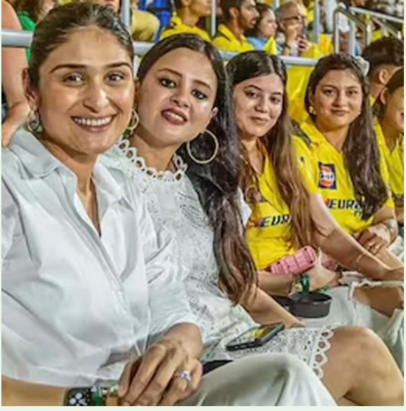
జై భీమ్ న్యూస్, సాక్షి:

చెన్నై చెపక్ వేదికగా హైదరాబాద్ సన్ రైజర్స్ వర్సెస్ చెన్నై సూపర్ కింగ్స్ టీమ్ లా మధ్య జరిగిన మ్యాచ్ లో చెన్నై టీమ్ 78 పరుగుల తేడాతో భారీ విజయాన్ని సాధించింది. ఇక మొదట బ్యాటింగ్ చేసిన చెన్నై టీం 212 పరుగులు చేయగా, హైదరాబాద్ టీమ్ మాత్రం 38 పరుగులకే ఆల్ అవుట్ అయింది. ఇక చెన్నై బౌలర్ అయిన తుషార్ దేవ్ పాండే 4 వికెట్లు తీసి హైదరాబాద్ టీమ్ ను కోలుకోలేని దెబ్బ కొట్టాడు. ఇక ఆయన దాటికి హైదరాబాద్ లోని స్టార్ షేయర్లందరూ పెవిలియన్ బాట పట్టడంతో చెన్నై ఈజీగా ఈ మ్యాచ్ ను తన ఖాతాలో వేసుకోగలిగింది. ఇక ఈ మ్యాచ్ తో చెన్నై ఐదు మ్యాచ్ లో గెలిచి నెంబర్ ట్రీ పొజిషన్ లో కొనసాగుతుంది. ఇక ఇలాంటి సందర్భంలో మహేంద్ర సింగ్ ధోని భార్య అయిన సాక్షి తన ఇన్ స్టా లో పెట్టిన స్టోరీ ఒకటి సోషల్ మీడియాలో విపరీతంగా వైరల్ అవుతుంది. ఇక సాక్షి సోషల్ మీడియా లో ఎప్పుడు చాలా యాక్టివ్ గా ఉంటుంది. ఇక అందులో భాగంగానే తనకు సంబంధించిన విషయాలన్నింటినీ సోషల్ మీడియాలో షేర్ చేసుకుంటూ ఉంటుంది. ఇక ఇప్పుడు కూడా ఈ మ్యాచ్ జరుగుతున్న నేపథ్యంలో " ప్లీజ్ ఈరోజు మ్యాచ్ తొందరగా ముగించండి. బేబీ ఈజ్ ఆన్ ది వే కాబోయే అతగా నా రిక్వెస్ట్ " అంటూ సాక్షి ఇన్ స్టా లో ఒక స్టోరీని అయితే పెట్టింది. ఇక దీంతో సాక్షి అత్యవసరం, ధోని మామ అవుతున్నాడు అంటూ చాలా మంది అభిమానులు సోషల్ మీడియా వేదికగా విపరీతమైన కామెంట్లు చేస్తున్నారు. ఇక ఇదిలా ఉంటే సాక్షి మాటలకు గౌరవం ఇచ్చిన ధోని చాలా తొందరగా ఈ మ్యాచ్ ను ముగించే ప్రయత్నం కూడా చేశాడు అంటూ మరి కొంతమంది వాళ్ళ అభిప్రాయాన్ని తెలియజేస్తున్నారు.