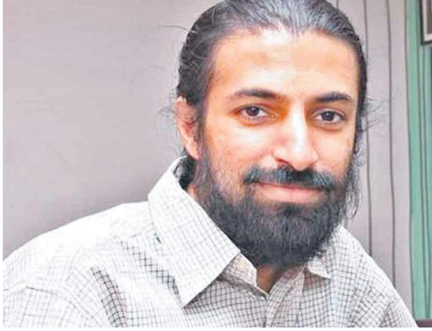
జై భీమ్ న్యూస్, సినిమా :

ప్రభాస్ నటిస్తున్న 'కల్కి 2898 ఏడీ' చిత్రం జూన్ 27న ప్రపంచవ్యాప్తంగా ప్రేక్షకుల ముందుకు రానున్న విషయం తెలిసిందే. కొద్దిరోజుల క్రితం విడుదల చేసిన డేట్ అనాన్స్ మెంట్ పోస్టర్ సోషల్ మీడియాలో వైరల్ గా మారింది. భారతీయ పురాణాధారితం మహాభారతం, సైన్స్ అంశాల కలబోతగా ఓ సరికొత్త ప్రపంచాన్ని సృష్టిస్తూ దర్శకుడు నాగ్ అశ్విన్ ఈ చిత్రాన్ని తెరకెక్కిస్తున్నాడు. ఇటీవల హైదరాబాద్ లో జరిగిన విఎఫ్ఎస్ సదస్సులో పాల్గొన్న నాగ్ అశ్విన్ 'కల్కి' సినిమా కథ తాలూకు పలు సంవేషాలకు సమాధానాలు ఇచ్చాడు. రిలీజ్ డేట్ అనాన్స్ మెంట్ సందర్భంగా విడుదల చేసిన ప్రచార చిత్రాన్ని ఉదహరించిన ఓ జర్నలిస్ట్ 'హాళీవుడ్ 'డ్యూస్' సినిమాతో 'కల్కి' ఏమైనా సంబంధం ఉందా?' అని ప్రశ్నించగా, దీనిపై నాగ్ అశ్విన్ స్పందిస్తూ 'రెండు చిత్రాల పోస్టర్ లో ఇసుక బ్యాక్ గ్రౌండ్ కనిపిస్తుంది. అందుకే పోలిక తీసుకొస్తున్నారు. నిజానికి రెండూ పూర్తి భిన్నమైన కథలు' అని చెప్పారు. సినిమా టైటిల్ గురించి నాగ్ అశ్విన్ మాట్లాడుతూ 'మహాభారతం చివర్లో మొదలై రానున్న 2898 ఏడీలో ముగిసే కథ ఇది. అందుకే ఆ టైటిల్ పెట్టాం. 6000 ఏళ్ల కాలవ్యవధి వరకు నడిచే కథ ఇది' అని వివరించారు. ప్రస్తుతం ఈ సినిమా నిర్మాణాంతర కార్యక్రమాలను జరుపుకుంటున్నది.