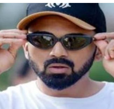
ఎదురైంది అని చెప్పాలి. అయితే తప్పకుండా వరల్డ్ కప్ జట్టులో చోటు సంపా

జై భీమ్ న్యూస్, సాక్షి : భారత క్రికెట్ ప్రేక్షకులు అందరూ ఎదురుచూస్తున్న సమయం రానే వచ్చింది. ఇటీవల బిసిసిఐ టీ20 వరల్డ్ కప్ కోసం ఎంపిక చేసిన జట్టు సభ్యుల వివరాలను ప్రకటించింది. ఈ క్రమంలోనే ఈసారి వరల్డ్ కప్ లో ఎవరికి చోటు దక్కతుందా అని అందరూ ఎంతో ఆసక్తిగా ఎదురు చూడగా.. ప్రస్తుతం ఐపీఎల్ లో రాణిస్తూ ఫేర్ ఫామ్ లో ఉన్న ఆటగాళ్లకి పెద్దపీట వేశారు టీమ్ ఇండియా సెలెక్టర్లు. ఈ క్రమంలోనే కొంతమంది కీలక ఆటగాళ్లకు ఊహించని రీతిలో చేరు అనుభవమే