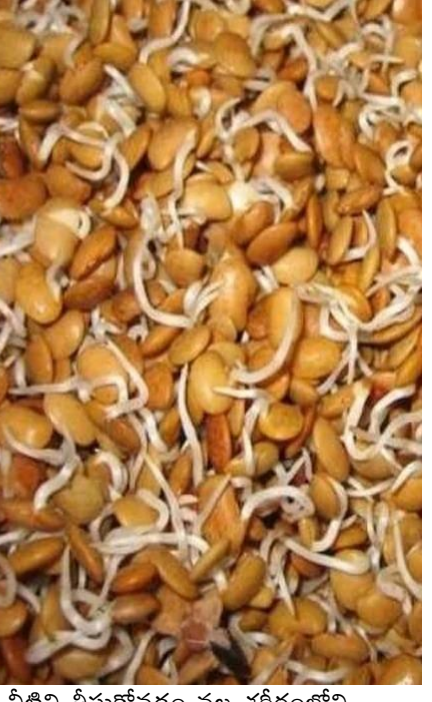
నీటిని తీసుకోవడం వల్ల శరీరంలోని మూత్రపిండాల్లో రాళ్లు తొలగిపోతాయి.

పెరిగే పిల్లలకు ఉలవలు తినిపిస్తే చాలా మంచిది. ఇవి పిల్లల శారీరక, మానసిక ఎదుగుదలలో సహాయపడతాయి. వారిని బలంగా ఉంచుతాయి. తరచూ ఎక్కిళ్లు వస్తుంటే ఉలవలు తీసుకోవడం చాలా మంచిది. ఉలవలు తినడం ద్వారా ఎక్కిళ్లు రాకుండా ఉంటాయి. బరువు ఎక్కువగా ఉన్నవారు ఉలవలు తింటే చాలా మంచిది. వీటిలోని ఫైబర్ శరీరంలో చెడు కొలెస్ట్రాల్ కలిగించడంలో సహాయపడుతుంది. తద్వారా బరువు నియంత్రిణలో ఉంచుతుంది. ఉలవల్లో ఫైబర్ కంటెంట్ ఎక్కువగా ఉంటుంది. ఇది పేగు కండరాల కదలికల్ని మెరుగుపరుస్తుంది. తద్వారా మలం సాఫీగా వచ్చేలా చేసి మలబద్దకం సమస్యను నివారిస్తుంది. ఓ కప్పు ఉలవ చారుకు సమానంగా కొబ్బరి నీళ్లు తీసుకుంటే మూత్రంలో మంట నుంచి ఉపశమనం పొందవచ్చు. తరచూ మూత్రంలో మంటతో బాధపడేవారు ఈ చిట్కా త్రా చేయండి.