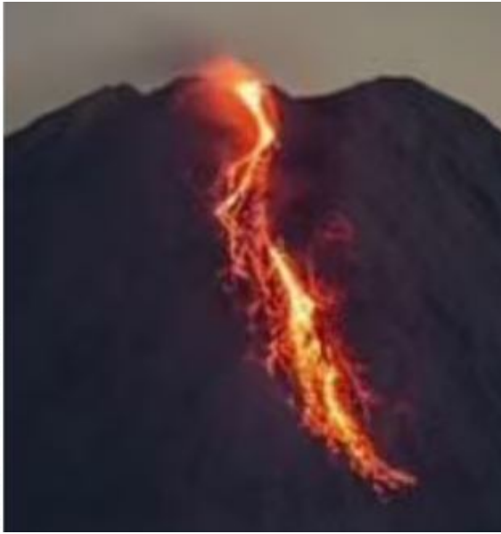
ఎవరూ వుండొద్దంటూ ప్రభుత్వ ప్రతినిధి హెచ్చరించారు. 1871లో ఇలాగే ఈ పర్వతం బద్దలై పెద్ద సంఖ్యలో కొండచరియలు విరిగిపడి నమూనాలో కూలిపోవడంతో స్థానికంగా పెద్ద ఎత్తున వచ్చిన అలలతో దాదాపు 400మంది మరణించారు. అనేక తీరప్రాంత గ్రామాలు మునిగిపోయాయి.