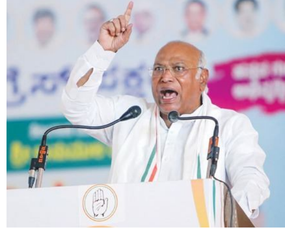
గాంధీ ఎంతో ధైర్యంతో జాతీయ గ్రామీణ ఉపాధి హామీ చట్టాన్ని తీసుకొచ్చారు. అలాగే ఆహార భద్రత చట్టం కూడా తెచ్చాం. బీజేపీ ఇలాంటివి ఏమైనా చేసిందా?' అని ఖర్గే ప్రశ్నించారు. మాజీ ప్రధానులు నెహ్రూ, ఇందిరా గాంధీ, లాల్ బహదూర్ శాస్త్రి, రాజీవ్ గాంధీలతో మోడీని పోల్చలేమని ఖర్గే అన్నారు. 'వారు దేశానికి ఉక్కు ఫ్యాక్టరీలు, టౌగ్ల గనులు, డ్యూమ్లు, ప్రభుత్వ సంస్థలు తీసుకొచ్చారు. మోడీ ఏమీ చేశారు.. జిజ్ఞాసు' అని ఖర్గే విమర్శించారు.

జై భీమ్ న్యూస్ డెస్క్: ముస్లింలకు మాత్రమే పిల్లలు ఉంటారా..? అని ప్రధానమంత్రి నరేంద్ర మోడీని కాంగ్రెస్ అభ్యర్థులు మల్లిఖార్జున ఖర్గే ప్రశ్నించారు. ముస్లింలపై ప్రధాని మోడీ చేస్తున్న 'అధిక సంఠానం', 'చౌరబాటుదారులు' వంటి ఆరోపణలను ఖర్గే తిప్పికొట్టారు. 'మేం మెజార్టీ దిశగా వెళుతున్నాం. ఈ కారణం చేతనే మోడీ ఎప్పుడూ మంగళసూత్రాలు, ముస్లింల గురించి మాట్లాడుతున్నారు. మేం (కాంగ్రెస్) మీ సొమ్మును దొంగిలించి ఎక్కువ మంది పిల్లలు ఉన్న వారికి (ముస్లింలకు) ఇచ్చేస్తామని మోడీ ఆరోపిస్తున్నారు. పేదలకు ఎక్కువ మంది పిల్లలు ఉంటారు. ముస్లింలకే ఎక్కువ మంది పిల్లలు ఉంటారా? నాకు ఐదుగురు పిల్లలు' అని ఖర్గే చెప్పారు. మంగళవారం ఛత్తీస్ గఢ్ లోని జంజ్గల్ -చంపా జిల్లాలో ఖర్గే ఎన్నికల ప్రచారంలో పాల్గొన్నారు. 'మోడీ ముస్లింలనే ఎందుకు లక్ష్యంగా చేసుకుంటున్నారు? వారు కూడా ఈ దేశంలో భాగమే. ఈ దేశాన్ని విచ్ఛిన్నం చేయవద్దు' అని ఖర్గే చెప్పారు. 55 ఏండ్ల పాటు దేశాన్ని కాంగ్రెస్ పరిపాలించింది, ఏ ఒక్కరి మంగళసూత్రాన్ని దోచుకోలేదని ఖర్గే గుర్తు చేశారు. 'మేం బలవంతంగా పన్నులు వసూలు చేయలేదు. ప్రజల్ని జైల్లో పెట్టడానికి ఈడీ, సీబీఐలను దురియ్యోగాగం చేయలేదు. సోనియా