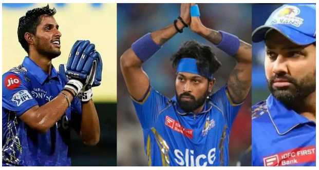
జై భీమ్ న్యూస్, సెక్స్ట్ :