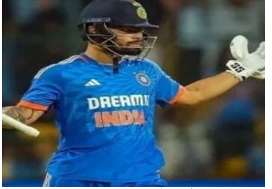
సెలెక్టర్లు ఇలా వివక్ష చూపడం నిజంగా అన్యాయం అంటూ అటు అభిమానులు సోషల్ మీడియాలో కామెంట్లు చేస్తూ బీసీపీపై ఆగ్రహం వ్యక్తం చేస్తున్నారు.

మాజీలు ఘాటు విమర్శలు కూడా చేస్తున్నారు. అయితే ఇలా లింకు సింగ్ ను ఎందుకు భారత జట్టులోకి సెలెక్ట్ చేయలేకపోయాము అనే విషయంపై టీమ్ ఇండియా చీఫ్ సెలెక్టర్ అజిత్ అగర్వల్ స్పందిస్తూ ఆసక్తికర వ్యాఖ్యలు చేశారు. దురదృష్టవశాత్తు టీ20 వరల్డ్ కప్ కు లింకు సింగ్ ను ఎంపిక చేయలేకపోయా మని అజిత్ అగర్వల్ చెప్పుకొచ్చాడు. జట్టులో ఎక్స్ ట్రా బోలర్ అవసరం ఉండడంతోనే లింకు సింగ్ కి చోటు దక్కలేదు అంటూ అజిత్ అగర్వల్ చెప్పుకొచ్చాడు. కానీ టీ20 వరల్డ్ కప్ కు అతనిని సెలెక్ట్ చేయకపోవడంతో లింకు ఫ్యాన్స్ అందరూ కూడా తీవ్రంగా నిరాశకు గురి అయ్యారు ఐపీఎల్ తో పాటు గత టీ20 మ్యాచ్ లో కూడా అద్భుతంగా రాయించిన అతన్ని పక్కన పెట్టడం ఇక భారత జట్టుకు ఎంతో మైనస్ గా మారుతుంది అంటూ మాజీలు అభిప్రాయం వ్యక్తం చేస్తూ ఉండగా లింకు సింగ్ పై