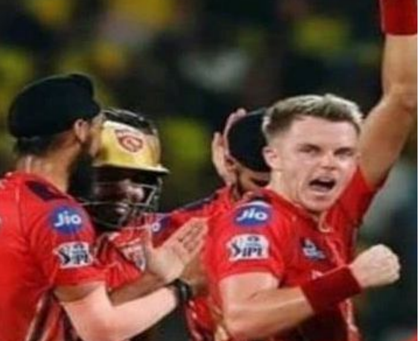
కింగ్స్ జరిగిన మ్యాచ్ లో చెన్నై సూపర్ కింగ్స్ తప్పకుండా భారీ విజయాన్ని సాధిస్తుంది అని అభిమానులు అందరూ కూడా అంచనాలు పెట్టుకున్నారు. కానీ ఊహించని

జై భీమ్ న్యూస్, సెక్స్ట్ : ప్రస్తుతం ఐపీఎల్ లోని ప్రతి మ్యాచ్ కూడా ఉత్సాహ భరితంగా సాగుతూ ప్రేక్షకులందరికీ కూడా ఆదిరిపోయే ఎంటర్టెన్మెంట్ పంచుతూ ఉంది అన్న విషయం తెలిసిందే. అయితే ఏ మ్యాచ్ లో ఎవరు విజయం సాధిస్తారు అనే విషయంపై మాత్రం ఉత్సాహం నెలకొంటుంది. చివరి వరకు కూడా ఎంతో రసవత్తరంగా సాగుతున్న మ్యాచ్ ఇక భారీ స్కోర్లు నమోదు అవుతున్నాయి అని చెప్పాలి. ఇక ఇరు జట్టు కూడా భారీ స్కోర్ల నమోదు చేస్తూ గెలుపు కోసం వీరోచితమైన పోరాటం చేస్తున్నాయి. దీంతో ప్రతి మ్యాచ్ లో కూడా అనూహ్యమైన ఫలితాలు వస్తూ ఉండడం గమనార్హం. అయితే ఇటీవల చెన్నై సూపర్ కింగ్స్, పంజాబ్ కింగ్స్ జట్ల మధ్య జరిగిన మ్యాచ్ కూడా ప్రేక్షకులు ఊహించని ఫలితం వచ్చింది. ఈసారి ఋతురాజ్ గైక్వాడ్ కెప్టెన్ గా బరిలోకి దిగిన చెన్నై సూపర్ కింగ్స్ జట్టు మంచి ప్రదర్శన చేస్తూ ఆకట్టుకుంటుంది. ప్లే ఆఫ్ లో అడుగు పెట్టేలాగే కనిపిస్తూ ఉంది అని చెప్పాలి. ఇటీవల పంజాబ్