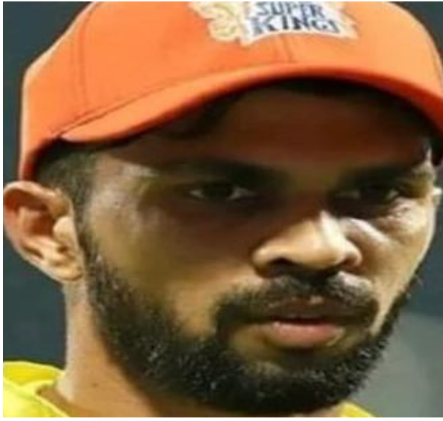
జై భీమ్ న్యూస్, సెక్స్ట్ :

సాధారణంగా టీ20 ఫార్మాట్లో బ్యాట్స్ మెన్ లదే ఆధిపత్యం కొనసాగుతుంది అని విశ్లేషకులు ఎప్పుడూ చెబుతూ ఉంటారు. ఎందుకంటే తక్కువ బంతుల్లోనే ఎక్కువ పరుగులు చేయాలి అనే టార్గెట్ ఆటగాళ్లపై ఉంటుంది. ఈ క్రమంలోనే ఇక బ్యాటింగ్ చేయడానికి వచ్చిన ప్రతి ఆటగాడు కూడా సిక్కుర్ ఫోర్ట్ చెలరేగిపోతూ ఉండడం చూస్తూ ఉంటాం. అయితే ఐపీఎల్ లో కూడా ఇలాంటి బ్యాటింగ్ విధ్వంసం ప్రతి సీజన్లో కూడా కనిపిస్తూ ఉంటుంది. కానీ ఇప్పుడు 2024 ఐపీఎల్ సీజన్ మాత్రం మరొక స్టైల్. బ్యాటింగ్ విధ్వంసం అనే పదానికి ఇక ప్రస్తుత ఐపీఎల్ సీజన్ కేరాఫ్ అడ్రస్ గా మారిపోయింది అని చెప్పాలి. ఏకంగా అద్భుతమైన ఆట తీరుతో అటు ఆటగాళ్లు విధ్వంసం సృష్టిస్తున్న తీరు అభిమానులు అందరినీ కూడా ఆశ్చర్యానికి గురిచేస్తుంది. ప్రతి మ్యాచ్ లో కూడా 200కుపైగా పరుగులను ఎంతో అలవోకగా కొట్టేస్తున్నారూ ఆటగాళ్లు. ఈ క్రమంలోనే టాప్ స్కోర్లగా ఉండేందుకు తెగ పోటీ పడుతున్నారు అని చెప్పాలి. ఆర్పిబి జట్టులో కీలక ప్లేయర్గా కొనసాగుతున్న విరాట్ కోహ్లాకి కూడా ఆదిరిపోయే ప్రదర్శన చేస్తున్నాడు. జట్టు గెలుపు ఓటమితో సంబంధం లేకుండా బ్యాటింగ్ విధ్వంసం సృష్టిస్తున్నాడు. ఈ క్రమంలోనే మొన్నటి వరకు విరాట్ కోహ్లా ఐపీఎల్ సీజన్లో టాప్ స్కోర్ గా కొనసాగుతూ ఆరెంజ్ క్యాప్ హోల్డర్ గా ఉన్నాడు అన్న విషయం తెలిసిందే. అయితే ఇటీవల పంజాబ్ కింగ్స్ తో జరిగిన మ్యాచ్ లో మాత్రం చెన్నై సూపర్ కింగ్స్ కెప్టెన్ రుతురాజ్ గైక్వాడ్ విరాట్ కోహ్లాని దాటేశాడు. ఏకంగా రుతురాజ్ 59 పరుగులు చేసి అత్యధిక పరుగుల వీరుడుగా అవతరించాడు. పంజాబ్ కింగ్స్ తో జరిగిన మ్యాచ్ లో 62 పరుగులతో రాణించిన ఋతురాజ్ 500 పరుగులతో మొదటి స్థానంలో ఉన్న విరాట్ కోహ్లాని వెనక్కి నెట్టి అగ్రస్థానంలోకి వచ్చాడు అని చెప్పాలి.