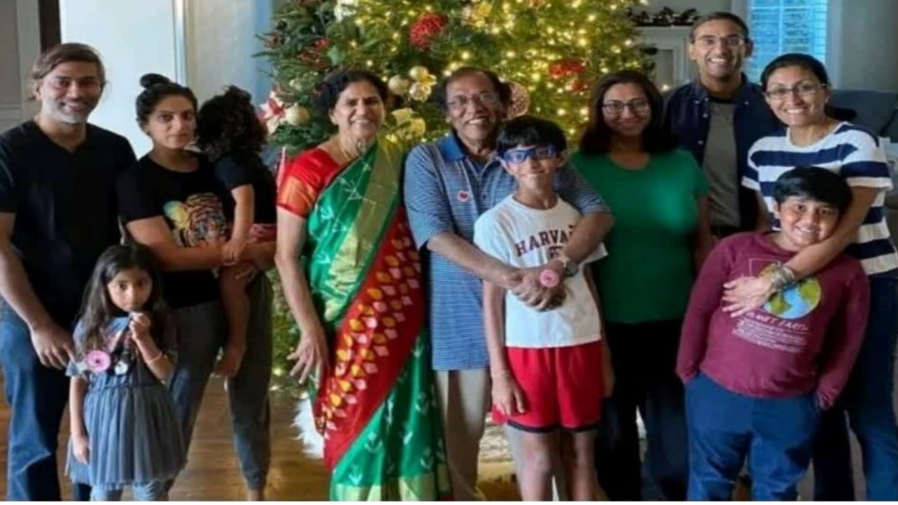
హైదరాబాద్ జై భీమ్ న్యూస్: అమెరికాలో స్థిర పడిన తెలుగుకుటుంబం గొప్ప మనసు