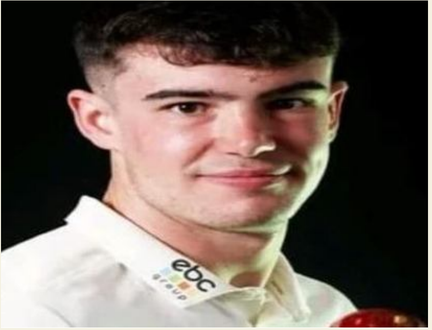
క్రికెట్లో ఇలాంటి విషాదకర ఘటన చోటుచేసుకుంది. దీంతో ఈ విషయం తెలిసి భారత క్రికెట్ ఫ్యాన్స్ కూడా విచారం

జై భీమ్ న్యూస్, సెక్స్ట్ : సాధారణంగా ఇండియాలో క్రికెట్ కు ఏ రేంజ్ లో క్రేజ్ ఉందో ప్రత్యేకంగా చెప్పాల్సిన పనిలేదు. ఏకంగా క్రికెటర్లను దేవుళ్లు లాగా ఆరాధిస్తూ ఉంటారు. ప్రేక్షకులు, ఇండియాలో ఎన్నో రకాల క్రీడలు ఉన్నప్పటికీ ఎందుకో క్రికెట్ ని అమితంగా అభిమానిస్తూ ఉంటారు. క్రికెట్ మ్యాచ్ వస్తుంది అంటే చాలు ఇక టీవీలకు అతుక్కుపోతూ ఉంటారు. చిన్నల నుంచి పెద్దల వరకు ఇలా క్రికెట్ ఆటకు వీరాభిమానులుగా కొనసాగుతూ ఉంటారు అని చెప్పాలి. అయితే ఇలా ఇండియాలో క్రికెట్ కి ఓ రేంజ్ లో క్రేజ్ ఉంటుంది కాబట్టి.. క్రికెట్ కు సంబంధించి ఏ విషయం తెరమీదికి వచ్చినా అది హాట్ టాపిక్ గా మారిపోతూ ఉంటుంది. సాధారణంగా ప్రాఫెషనల్ క్రికెట్లో ప్లేయర్లు కొనసాగుతున్న అటగాడు ఎవరైనా ఆకస్మికంగా మరణించాడు అంటే చాలు అది సోషల్ మీడియాలో వైరల్ గా మారిపోతూ ఉంటుంది. అయితే ఇంగ్లాండు