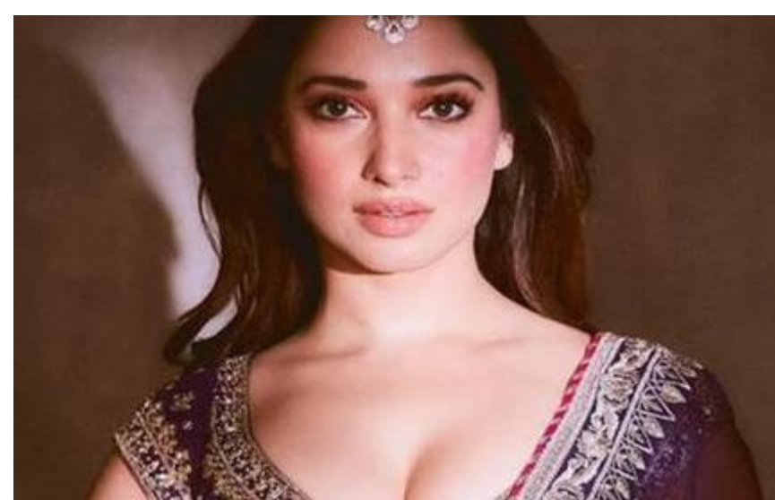
తొలగించడం పూర్తిగా మానేశాను అని చెప్పింది. ఆ సినిమాలో వ్యాక్స్ తో పలు రకాలుగా చంపేస్తారు అని, ఆ మూవీ తర్వాత నుండి చర్మంపై రోమాలను తొలగించడం మానివేసినట్లు మిల్కీ బ్యూటీ తాజా ఇంటర్వ్యూ లో భాగంగా చెప్పింది.

కీలక పాత్రలో నటించింది ఈ మూవీ మే 3 వ తేదీన విడుదల కానుంది. ఈ సినిమా తమిళ తో పాటు తెలుగు లో కూడా విడుదల కానుంది. తెలుగు లో ఈ సినిమా "బాక్" అనే టైటిల్ తో విడుదల కానుంది. ఈ మూవీ తెలుగు వర్షన్ ను కూడా మే 3 వ తేదీనే రిలీజ్ కానుంది. ఈ సినిమా విడుదల తేదీ దగ్గర పడడంతో తమన్నా వరుస ఇంటర్వ్యూలలో పాల్గొంటూ ఈ సినిమాను ప్రమోట్ చేస్తుంది. అందులో భాగంగా తాజాగా ఈ బ్యూటీ ఇంటర్వ్యూ లో పాల్గొంది. ఆ ఇంటర్వ్యూలో భాగంగా తమన్నా ఓ సినిమా చూశాక తనకున్న ఒక అలవాటును పూర్తిగా మానేసినట్లు చెప్పుకొచ్చింది. తాజా ఇంటర్వ్యూలో తమన్నా మాట్లాడుతూ ... హాలీవుడ్ సినిమా హాస్ ఆఫ్ వ్యాక్స్ చూశాక చర్మం పై రోమాల