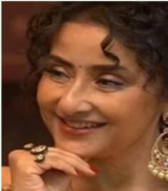
జై భీమ్ న్యూస్, సినిమా :

సాధారణంగా సిని సెలెబ్రిటీలకు సంబంధించిన ప్రొఫెషనల్ లైఫ్ తెలివిన వున్నకం లాంటిది. ఇక ఏ సినిమా చేస్తున్నారో.. ఏ సినిమా నుంచి తప్పుకున్నారు అన్న విషయం ఎప్పటికప్పుడు అభిమానులకు తెలుస్తూనే ఉంటుంది. అందుకే ప్రొఫెషనల్ లైఫ్ కంటే పర్సనల్ లైఫ్ గురించి తెలుసుకునేందుకు అటు అభిమానులు అందరూ కూడా తెగ ఆసక్తిని కనబరుస్తూ ఉంటారు అన్న విషయం తెలిసిందే. ఈ క్రమంలోనే ఇక సినిమా హీరో హీరోయిన్లకు సంబంధించి ఏదైనా పర్సనల్ విషయం ఇంటర్వెట్ లోకి వచ్చింది అంటే చాలు అది తెగ హాట్ టాపిక్ గా మారిపోతూ ఉంటుంది. ఇక ఈ మధ్యకాలంలో అయితే ఎంతో మంది హీరోయిన్లు తమ పర్సనల్ విషయాలను కూడా సోషల్ మీడియాలో అభిమానులతో పంచుకోవడానికి ఎక్కడ వెనకడుగు వేయడం లేదు. ఈ క్రమంలోనే కొన్ని కొన్ని సార్లు సిని సెలెబ్రిటీలు చెప్పే విషయాలు హాట్ టాపిక్ గా మారిపోతూ ఉంటాయి. ఇక కొంతమంది అయితే ఏకంగా తమ ఆరోగ్య సమస్యల గురించి కూడా అభిమానులతో పంచుకోవడం లాంటివి చేస్తూ ఉన్నారు అని చెప్పాలి. అయితే ఇటీవల బాలీవుడ్ సీనియర్ హీరోయిన్ మనిషా కోయిరాల ఇక తాను అనారోగ్య సమస్యలతో ఎదుర్కొన్న చేదు అనుభవాల గురించి ఇటీవల చెప్పకు వచ్చింది. కనీసం తాను బ్రతికి బిట్ట కడతాను అని అనుకోలేదు అంటూ షాకింగ్ విషయాల చెప్పింది ఈ సీనియర్ హీరోయిన్. మనిషా కోయిరాల గతంలో క్యాన్సర్ బారిన పడి కోలుకున్నారని అన్న విషయం తెలిసిందే. అయితే ఇటీవల ఒక ఇంటర్వ్యూలో పాల్గొన్న మనిషా కోయిరాల క్యాన్సర్ వ్యాధి వచ్చినప్పుడు ఎదురైన ఘటనల గురించి చెప్పుకొచ్చింది. క్యాన్సర్ తో పోరాడిన సమయంలో అనుభవించిన బాధను పంచుకుంది. అందాకర క్యాన్సర్ నాలుగో దశకు చేరడంతో జీవితం పై ఆశలు వదులుకున్నా.