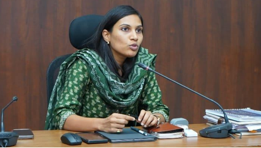
వరంగల్ జిల్లా జై భీమ్ న్యూస్ : ఈ నెల 13వ తేదీన జరగనున్న

పార్లమెంట్ ఎన్నికల దృష్ట్యా పోలింగ్ కేంద్రాల వద్ద కనీస సదుపాయాల కల్పన